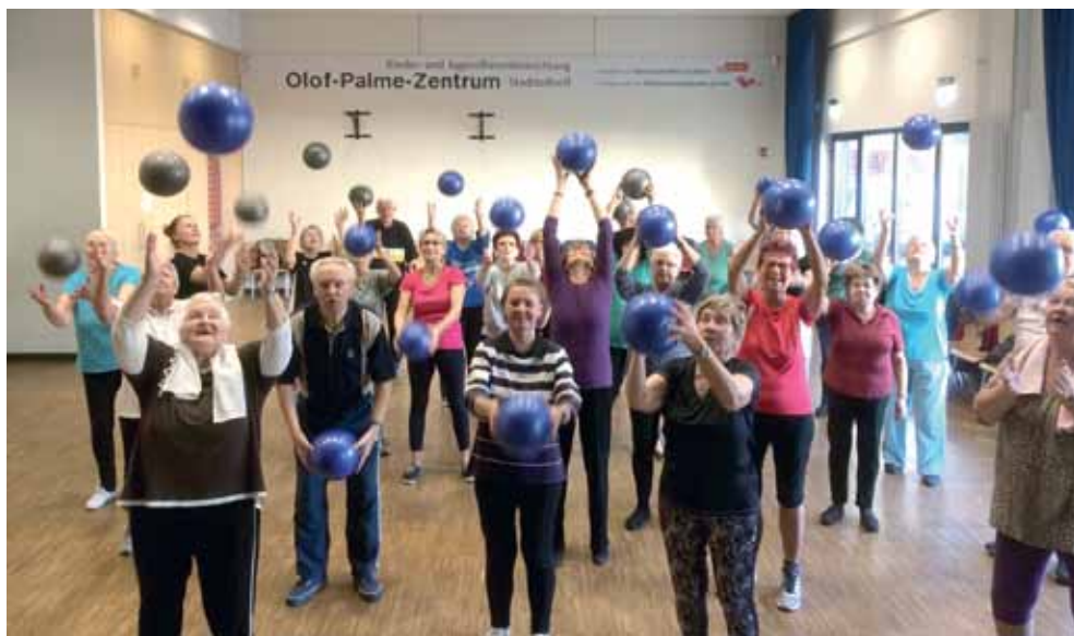
Juchu, neue Bälle für den Seniorensport! Finanziert wurden sie mit Mitteln aus dem Programm „Soziale Stadt“ (Aktionsfonds).