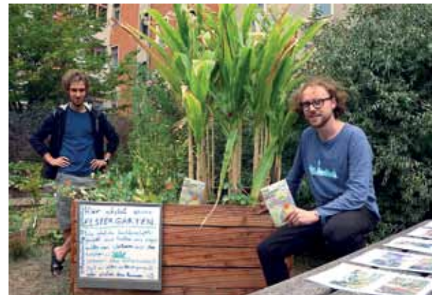
Der Elstergarten öffnete bei der letzten BruGa 2018 seine Pforten.