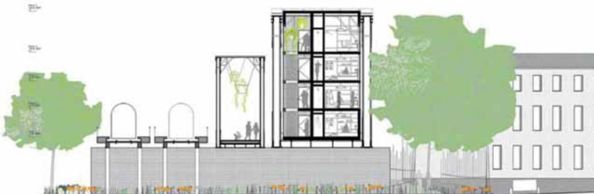
Eine erste Skizze für die Umnutzung der Liesenbrücken. Auch wenn sich die konkrete Ausführung noch verändern wird, sind die Größenverhältnisse der Planungen zu sehen. Grafik: CapRate