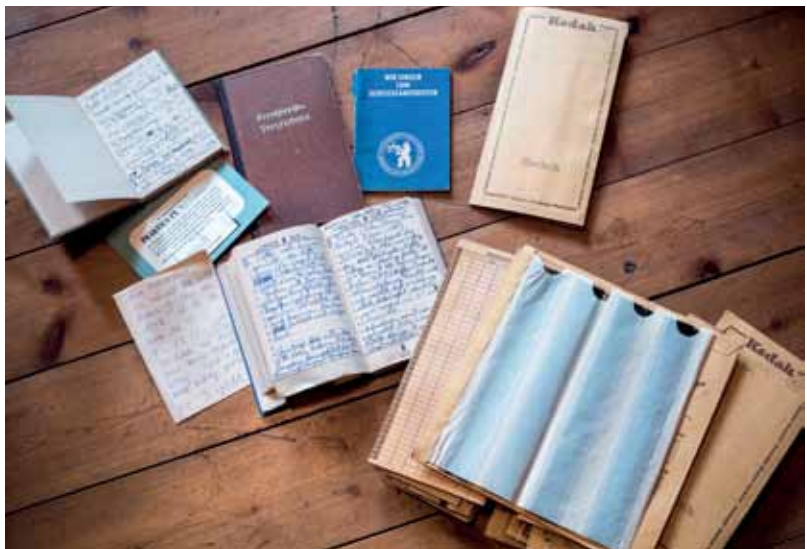
Ein Teil des Inhalts der rätselhaften Kiste.