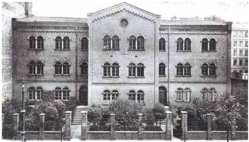
Die 17. Gemeindeschule Berlin in der Ackerstraße 67, hier um 1900, entstand 1862/63 auf einem 3.500 Quadratmeter großen Grundstück. Sie hatte 16 Klassenzimmer, ohne Aula, jedoch mit einer Turnhalle zur Hussitenstraße 56. Alle Gebäude der Schule wurden im Zweiten Weltkrieg zerstört.

von der Baufluchtlinie zurück oder quer gestellt und mit Vorgärten errichtet wurden. Dies ist anhand der auf den Fotografien dargestellten Schulen im Brunnenviertel und Umgebung gut erkennbar: