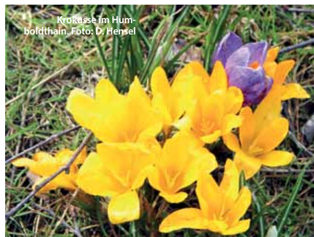
Krokusse im Humboldthain.