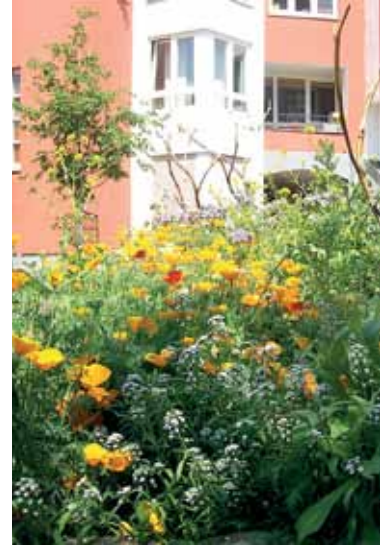
Fotos aus besseren Tagen: Die Gleim-Oase ist eine kleine Großstadtinsel in der Gleimstraße, auf der es grünt und blüht. Derzeit ist sie nicht ganz so schön bepflanzt, vor allem, weil helfende Hände fehlen.