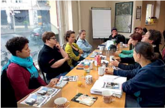
Bei einer Redaktionssitzung im Freizeiteck.

Für die professionelle Begleitung und für den Druck des brunnen erhält die Initiative Mittel aus dem Programm Soziale Stadt . Diese Förderung konnte mit einem starken Votum des Quartiersrats im Gebiet Brunnenstraße nochmals bis Ende 2022 verlängert werden. Seit Januar ist zudem ein neuer Unterstützer mit an Bord: Das Wohnungsbaunternehmen degewo fördert die Bürgerredaktion und ermöglicht damit einige Änderungen: ein größeres Format und eine höhere Auflage.