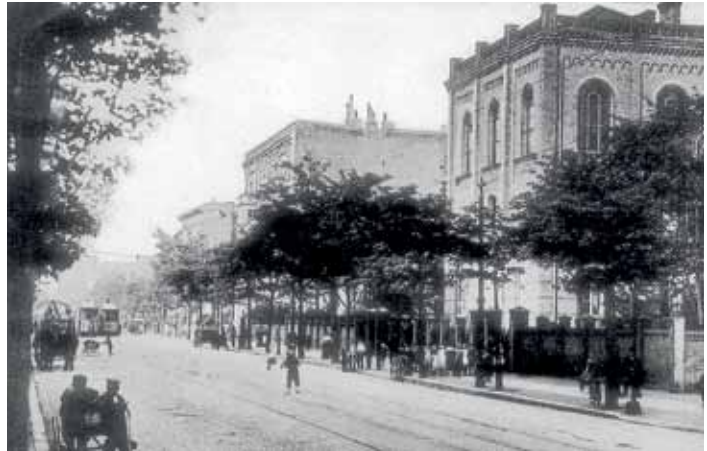
Auch die unweit des Brunnenviertels im Gesundbrunnen gelegene und unter Mitwirkung des Architekten Petersen 1864-66 erbaute 32. Gemeindeschule mit Aula und Turnhalle in der Pankstraße 47, heute „Mitte-Museum“, zählt zu den Bauten von Gerstenberg. Die Aufnahme stammt von 1909.