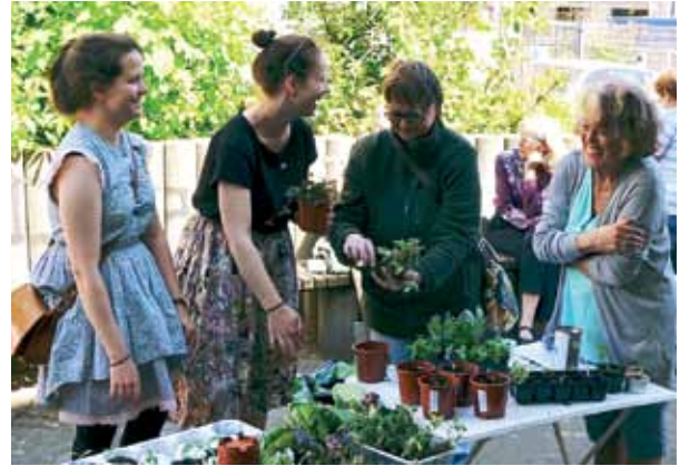
Falls das Vorziehen zu gut geklappt hat: Tausche doch einfach ein paar Sämlinge mit deinen Nachbarn!

Im Kiez gibt es vom Gemeinschaftsgarten im Hinterhof über begrünte Baumscheiben, schicke Balkone, Hochbeete und Pflanzschalen bis hin zu Dachgärten viel zu entdecken. Am 22. und 23. August öffnen sie zur Brunnenviertel Gartenschau, der BruGa, ihre Pforten. Sei dabei! Weitere Infos und Anmeldung per E-Mail unter bruga@brunnenviertel.de .