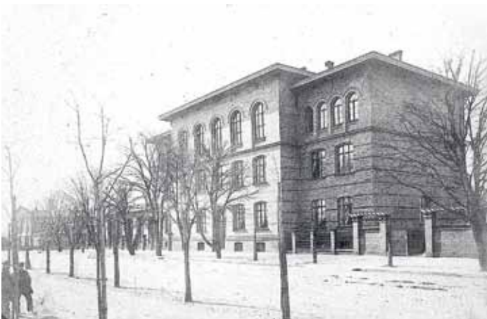
Höchstwahrscheinlich entstand nach seinen Entwürfen auch die heute noch erhaltene einstige 73. Gemeindeschule mit 16 Klassenräumen, Aula und Turnhalle in der Wiesenstraße, heute Teil der Humboldthain-Grundschule, die aber erst unter der Ägide seines Nachfolgers erbaut und am 10. August 1876 eröffnet wurde. Foto um 1896