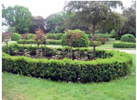
Der Wasserlauf im Humboldthain ist besonders für Kinder im Sommer ein beliebtes Ziel. Das Wasser wird bei warmen Temperaturen angestellt. Unten: Im Rosengarten gibt es schöne Beete mit Blumen und Büschen.