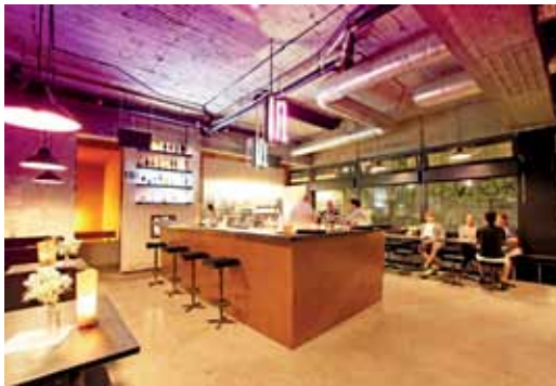
Das Volta von innen. Foto linke Seite: Ein Blick von außen in den Gastraum. Unten: Ein Cocktail und ein Gericht von der Karte des Volta. Fotos: Volta

Das Volta, Brunnenstraße 73, Dienstag bis Sonnabend ab 18 Uhr geöffnet, Speisekarte und weitere Informationen gibt es im Internet unter www.dasvolta.com