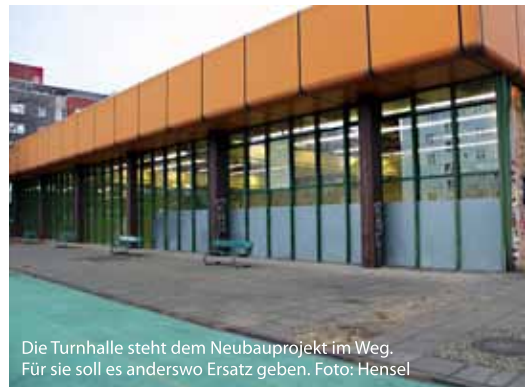
Die Turnhalle steht dem Neubauprojekt im Weg. Für sie soll es anderswo Ersatz geben.

Der Berliner Senat hatte schon im September 2016 den Bau von sogenannten Typensporthallen ausgeschrieben. Denn in ganz Berlin gibt es das Problem, dass Sporthallen schnell entstehen sollen. Das ist nun die Lösung: Einer dieser standardisierten Bauten wird im Brunnenviertel entstehen. Sie wird zwar nur einstöckig, dafür eine Drei-Felder-Halle sein. Statt in ferner Zukunft kann der Bau der neuen Vineta-Halle nun schon 2018 beginnen. Dann geht auch die Entwicklung des alten Gymnasiumsstandorts weiter: Denn wenn die neue Sporthalle wirklich steht, darf die alte abgerissen werden. Die Schule und die Vereine freuen sich jedenfalls schon auf die moderne und wettkampftaugliche Sporthalle.