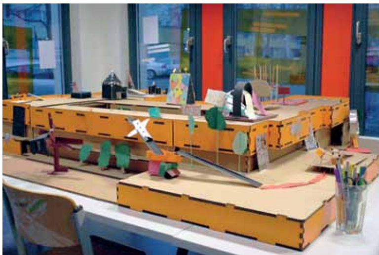
Ein Haus aus Pappe: Kinder aus dem Brunnenviertel entwickelten ihre Ideen für die alte Schule und bauten das orangefarbene Gebäude in den Kinder-Kunst-Werkstätten um.