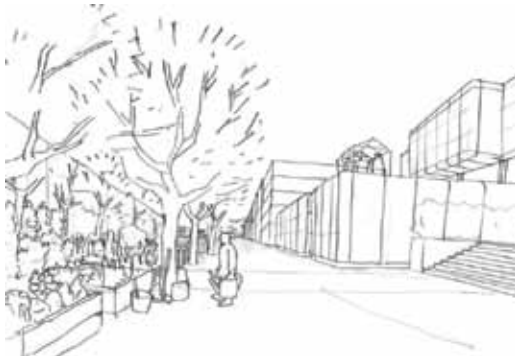
Eine erste Skizze für das Projekt am alten Schulstandort. Rechts ist das umgebaute Gebäude, links ein Gemeinschaftsgarten zu sehen. Zeichnung: ps wedding

Mehr über ps wedding gibt es im Internet auf der Seite www.pswedding.de