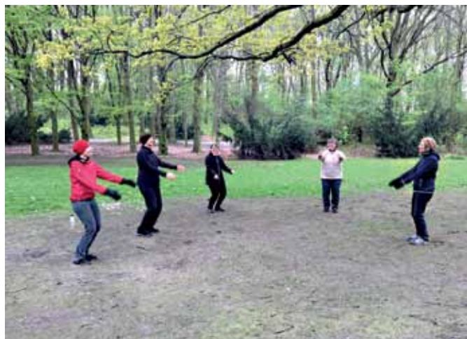
Heigl im Humboldthain.

Aktuelle Informationen zu diesen und anderen Kursen werden im Internet auf der Seite www.bewegung-draussen.de veröffentlicht – dort steht auch, wenn mal ein Kurs ausfällt.