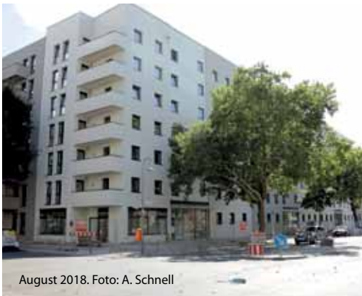
August 2018.