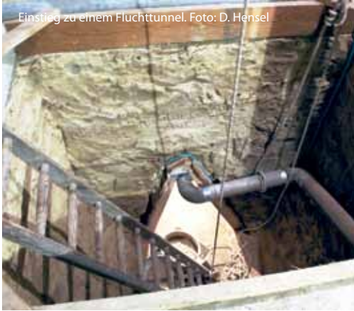
Einstieg zu einem Fluchttunnel.

groß, dass in der Enge Panik ausbricht. Glücklicherweise kommt es nicht dazu und alle entsteigen durchnässt und verschmutzt, aber unendlich erleichtert dem Stollenausgang in einem Hinterhof der Bernauer Straße 78.