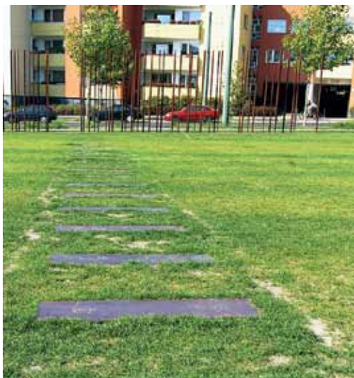
Mauergedenkstätte an der Bernauer Straße mit markiertem Verlauf eines Fluchttunnels.

hindurchgeschleust werden kann. Doch die Bernauer Straße ist auch Schauplatz der beiden spektakulärsten Fluchten durch den Berliner Untergrund.