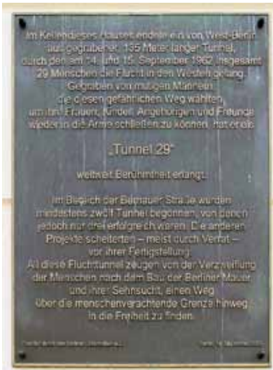
Informationstafel an der Bernauer Straße für den Tunnel, durch den 29 Menschen in die Freiheit kamen.

Noch dramatischer verläuft eine Flucht zwei Jahre später, in der Nacht vom 3. auf den 4. Oktober 1964. Vom Keller einer ehemaligen Bäckerei in der zum Wedding gehörenden Bernauer Straße 97 haben Fluchthelfer einen 145 Meter langen Tunnel gegraben, der auf Ostberliner Seite in den Hof der Strelitzer Straße 55 mündet. 57 Menschen sind bereits in den Schacht gestiegen, als plötzlich bewaffnete Grenzer den Hauseingang betreten. Es kommt zu einem Schusswechsel, bei dem ein Soldat erschossen wird. Die DDR-Führung schlachtet dieses Ereignis propagandistisch aus und verurteilt die Fluchthelfer als „Mordschützen“. Nach der deutschen Wiedervereinigung stellt sich jedoch heraus, dass der Unteroffizier Egon Schultz von den eigenen Leuten tödlich getroffen wurde.