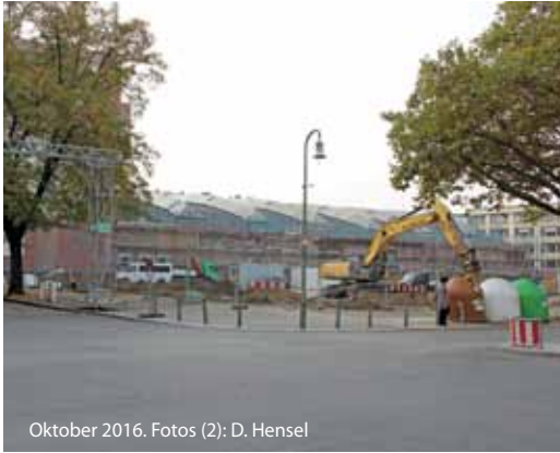
Oktober 2016.