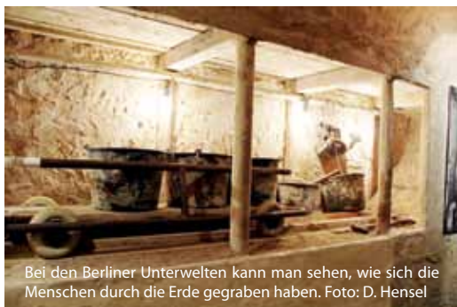
Bei den Berliner Unterwelten kann man sehen, wie sich die Menschen durch die Erde gegraben haben.

In den 1960er und 1970er Jahren entstehen unter der Bernauer Straße insgesamt 15 Tunnel. Die meisten fliegen auf, noch ehe jemand