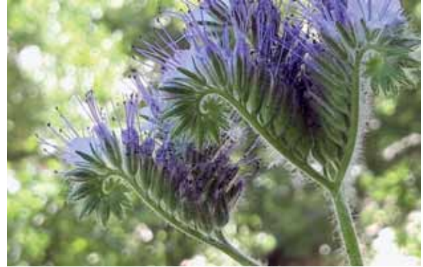
Die Phazilien sehen nicht nur schön aus, sondern bieten reichlich Nektar und Pollen.