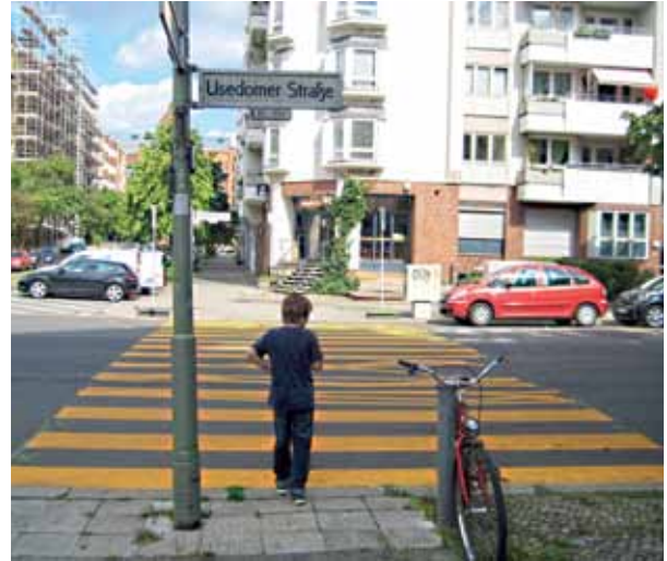
Provisorischer Zebrastreifen in der Jasmunder Straße.

„Bezüglich Ihrer Anfrage teile ich Ihnen seitens des Bezirksamts Mitte mit: Es sind zwei Querungshilfen als Mittelseln in diesem Bereich vorgesehen.“ Sie sollen jeweils rechts und links der Kreuzung zur Jasmunder