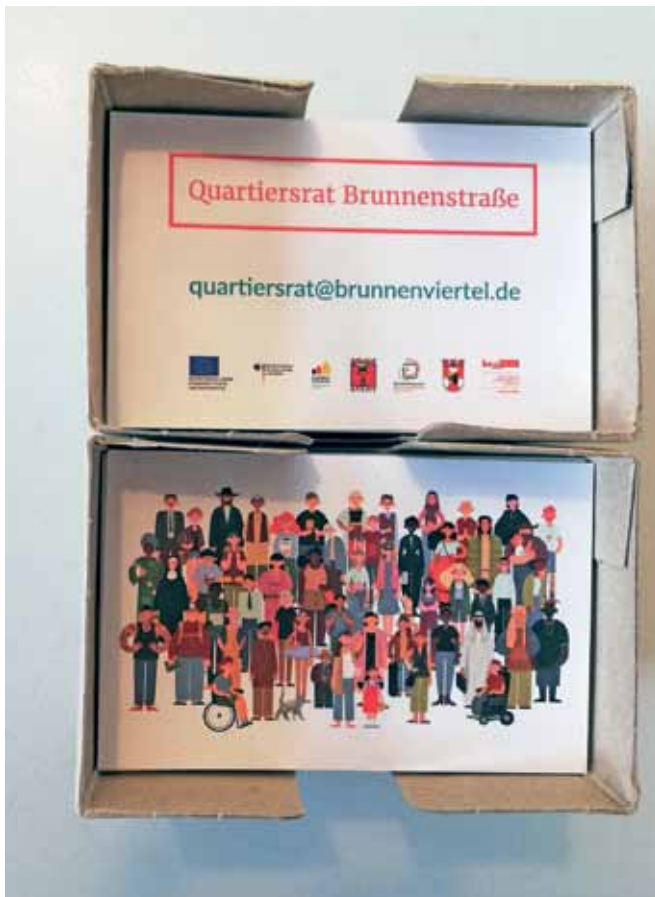
Alle zusammen für den Kiez: Visitenkarten der Quartiersratsmitglieder im Brunnenviertel.