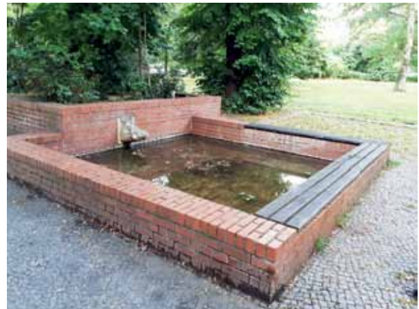
Trübe Aussichten: Nilpferdbrunnen am Vinetaplatz.