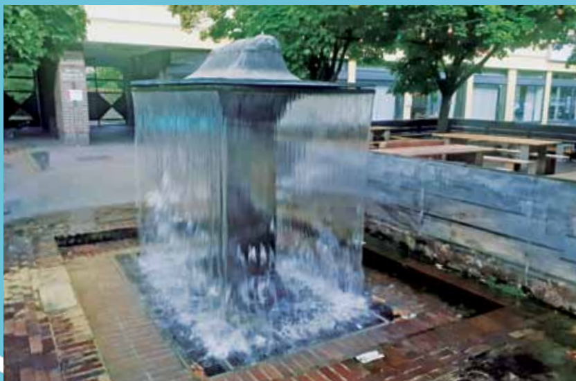
2020 noch in voller Wasserpracht, jetzt Ebbe: Brunnella.