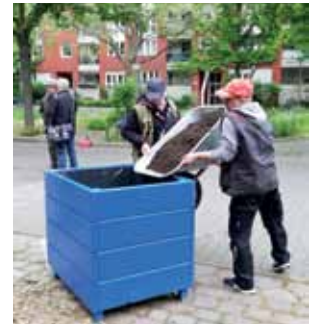
Eindrücke von der Aktion zum Auftakt des Diesterbeets Ende Mai. Viele Nachbarn halfen mit.