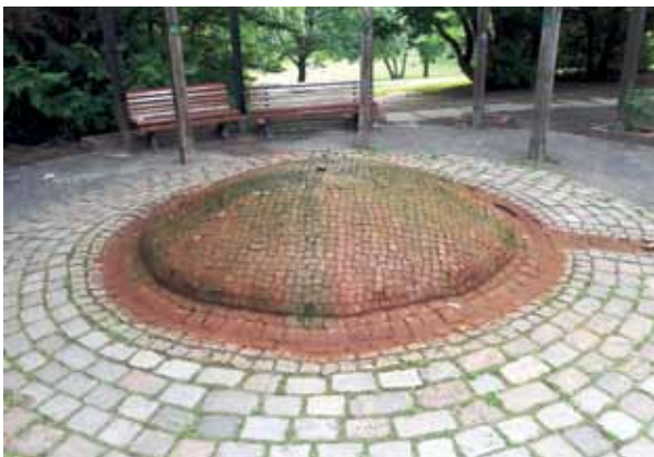
Auf dem Trockenen: Nur selten sprudelndes Wasserspiel im Humboldtthain.

Im Ostteil des Humboldtthains finden wir auf einer Anhöhe ein nur selten sprudelndes Wasserspiel von unbekannter Hand, wahrscheinlich aus den Fünfzigerjahren stammend. Aus Kleinpflastersteinen wurde ein kompakter runder Hügel von etwa 40 Zentimeter Höhe und zwei Meter Durchmesser geformt. In der Mitte strömt aus einer Düse Wasser nach allen Sei-