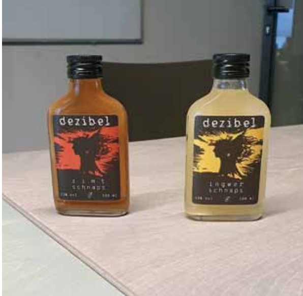
Nach furchtlosem Selbsttest empfiehlt der Autor die Ingwer-Variante.

Simon: Auf jeden Fall! Im Wedding ist es aber auch sehr schwer. Wir gucken immer mal wieder auf der Straße, wenn eine Anzeige aushängt. Da hab ich auch mal Kontakt zu einer Anbieterin aufgenommen, aber danach nie wieder was gehört. Wenn man kein großes Budget hat, ist es eigentlich unmöglich. In den Osram-Höfen zum Beispiel beträgt die Miete ungefähr das Dreifache von dem, was wir uns leisten können. Wären wir ein Software-Start-up, wäre das