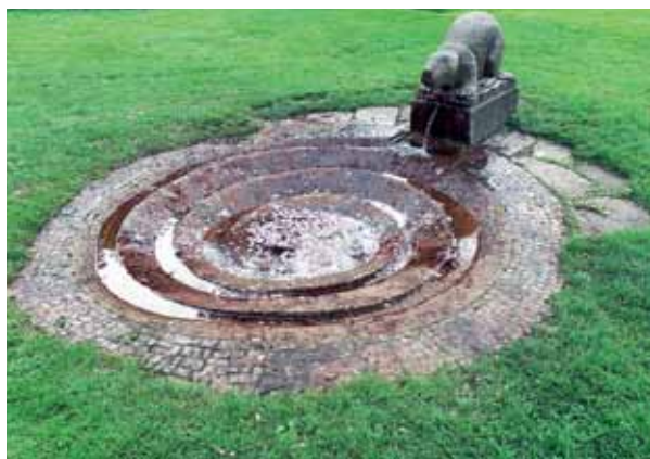
Artgerecht im Grünen: der Biberbrunnen im Rosengarten am Humboldtthain.

Seiten reichlich Wasser herab, das auf diese Weise eine flüssig-transparente Wand rings um den Sockel bildet. Das zur Zeit seiner Errichtung vermutlich namenlose Wasserspiel stammt von dem Künstler Paul Pfarr (1938–2020). Bereits 1966/67 soll Pfarr die heutige Brunnella entworfen haben, realisiert wurde das Projekt jedoch erst 1982. Über ein weiteres Kunstwerk des Künstlers, eine Kunst-Bau-Installation in der Brunnenstraße, wurde in der ersten Ausgabe des brunnen in diesem Jahr berichtet.