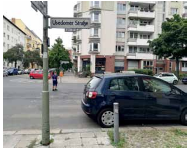
Aktueller Zustand: keine Querungshilfe.

Straße auf der Usedomer Straße eingerichtet werden. Die Umsetzungsarbeiten sind laut Bezirksamt für das erste Halbjahr 2022 geplant. Die Gesamtkosten für die beiden Querungshilfen belaufen sich auf etwa 20.000 Euro. Darin enthalten sind auch die nötigen Markierungsarbeiten. Die Baumaßnahme wird jedoch nicht vom Bezirk getragen. Die Mittel stammen aus dem Sonderprogramm „Maßnahmen zur Erhöhung der Verkehrssicherheit für Fußgänger“ der Senatsverwaltung für Umwelt, Verkehr und Klimaschutz.