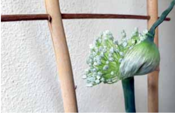
Endlich öffnet auch der Lauch seine Blüte – Seht, was ich zu bieten habe!

sammeln und entdeckte die Sonnen- und Schatten-seiten auf ihrem Balkon. Vor allem aber übte sie sich in Geduld. Ihr Lohn war die Freude an den Blüten sowie an zahlreichen Besuchern auf der Suche nach Nektar. Hier gewährt sie uns einen Blick auf ihren Balkon.