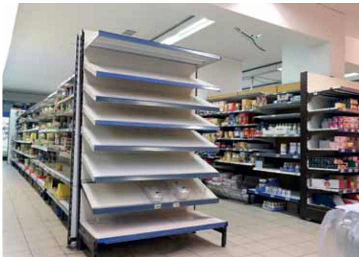
Leere Regale im Markt in der Ackerstraße kurz vor der endgültigen Schließung Ende Juli.