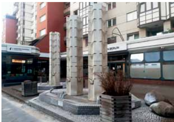
Schöne neue Welt von damals: Brunno, einst der Drei-Säulen-Brunnen.

Brunnos Gemahlin Brunnella (Name ebenfalls seit 2013) befindet sich etwa 150 Meter weiter nördlich. Sie besteht aus einem Marmorpodest, gekrönt von einem rechteckigen Metalldach, auf dem ein schwer identifizierbares Gebilde liegt, einer Mumie nicht unähnlich. Aus der Traufe des Dachs fließt nach allen