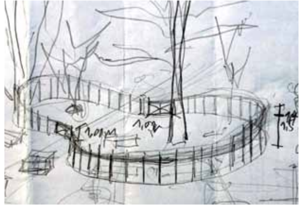
Der Bienenplatz: Ausschnitt einer Skizze von Diego Jurado.

Mai 2021: Anfertigen der beiden Zauntüren unter Anleitung von Zimmerer Peter. Sicherung der Türen mit Kette und Schloss. Aufschütten eines Sandberges für Wildbienen.