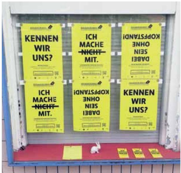
Plakate im Fenster des Quartiersmanagements weisen auf die Kiezwahl im Herbst hin.