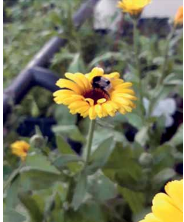
Landeplatz Calendula – Welche Position ist wohl am besten?