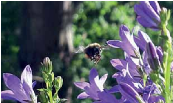
Im Anflug an die Polsterglockenblume – Welche Blüte nehme ich zuerst?