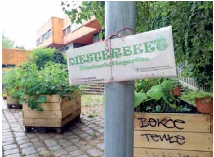
Noch ist das Schild am neuen Stadtgarten provisorisch.

Der Stadtteilverein initiierte gemeinsam mit den betroffenen Menschen die Mach-Mit-Gruppe, holte das Quartiersmanagement und die Stadtteilkoordination mit ins Boot. Es gab gemeinsame Treffen, um zu überlegen, wie die Situation verbessert werden könnte. Auf der Swinemünder Straße fanden unter anderem Sprühaktionen statt, um mit weiteren Nachbarn ins Gespräch zu kommen. Mit Schablonen und Sprühkreide