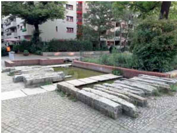
Nunmehr stehendes Gewässer: Kaskade am Vinetaplatz.

Zum Abschluss gönnen wir uns einen Schluck Wasser am Trinkbrunnen am Vinetaplatz. Der 2017 installierte Wasserspender geht auf eine Zusammenarbeit der Berliner Wasserbetriebe mit den Organisatoren des Massenlaufs Brunnen Run zurück: Läufer sorgten mit ihren während eines Jahres zurückgelegten Kilometern symbolisch für die Bezahlung der Brunnenaktion. Fazit: ein erbaulicher wie lehrreicher Spaziergang durch den Kiez, wenn auch (mitten im Sommer!) nur drei der vorgestellten seinen Anlagen in Betrieb waren. Warum nicht mehr?