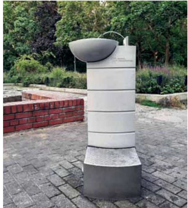
Labial nicht nur für Läufer: Wasserspender in der Swinemünder Straße.

Vom selben Architekten stammt auch der schräg gegenüberliegende Nilpferdbrunnen. An einem viereckigen verklüfteten Becken ist seitlich der etwa 50 Zentimeter hohe aus Sandstein gearbeitete Kopf eines Flusspferdes angebracht, aus dem ein schmales Rinnsal in das Becken rieselt. Sitzgelegenheiten laden zum Verweilen ein, doch leider macht diese Anlage (wie auch der Schwellenbrunnen) mittlerweile einen ziemlich ungepflegten Eindruck.