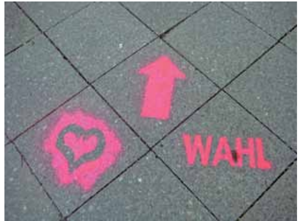
Demnächst steht auch im Quartier eine Wahl bevor: Der Quartiersrat und die Aktionsfondsjury werden neu besetzt.

Stellen frischen Wind und vor allem eins: mehr Vielfalt. Auch wenn wir als Quartiersratsmitglieder unterschiedliche Interessen, Blickwinkel und Standpunkte haben, so repräsentieren wir nicht wirklich unser Viertel. Ich wünsche mir deshalb, dass bei der diesjährigen Wahl neue Impulse in den Quartiersrat getragen werden und die Menschen hier im Kiez sehen, dass sie sich beteiligen können. Sei es durch die Wahl oder die eigene Kandidatur.