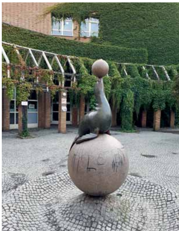
Nicht in ihrem Element: „Robbe“ vor der Heinrich-Seidel-Schule (Ramlerstraße).

ten über den Hügel hinab und wird von einer flachen Rinne aufgenommen und abgeleitet. Leider ist dieses Schauspiel nur zu sehen, wenn das Bezirksamt an heißen Tagen zur Freude der Kinder das Wasser anstellt.