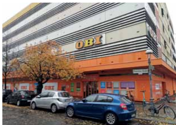
Immer praktisch und gut, dass er so nah ist: der Baumarkt Obi.