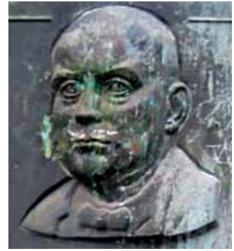
Ausschnitt einer Gedenktafel für Ernst Moritz Geyger in Berlin-Neukölln.

1941 starb Ernst Moritz Geyger im italienischen Florenz, doch schon zu seinen Lebzeiten, im Jahre 1912 wurde eine Straße in Neukölln nach ihm benannt. Sie verbindet die Sonnenallee mit der Donaustraße. Seine wohl bekannteste (und vielkopierte) Arbeit, der Bogenschütze, steht heute sowohl im Park Sanssouci in Potsdam als auch am Dresdener Elbufer.