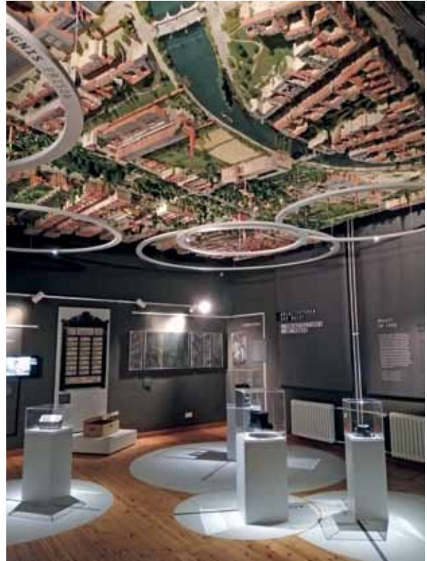
Blick in die neue Dauerausstellung des Mitte Museums.

Heute ist in dem Gebäude das Mitte Museum zu finden. Ich schaue mir die neue Dauerausstellung „Gewachsen auf Sand“ an, die nach der kürzlichen Komplettanierung des Museums seit Ende April zu sehen ist. Sie zeigt die Entwicklung des Stadtbezirks Mitte mit seinen Ortsteilen Gesundbrunnen, Hansaviertel, Mitte, Moabit, Tiergarten und Wedding über die letzten 250 Jahre hinweg. Auf dem Weg von Raum zu Raum begleiteten mich interaktive Karten sowie ein plastisches Modell, das den Stadtteil Moabit um 1900 darstellt. Leider fällt mir die Orientierung darauf schwer, weil ich nach Straßennamen und Gebäudezeichnungen meist vergeblich suche.