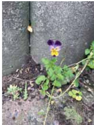
Ein blühendes Hornveilchen auf der Gleim-Oase.