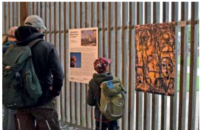
Bei der Ausstellungseröffnung in der Kapelle der Versöhnung.

Weitere Fotos von unserem Autoren von der Eröffnung der Ausstellung sind auf dem Redaktionsblog ( www.brunnenmagazin.wordpress.com ) zu sehen.