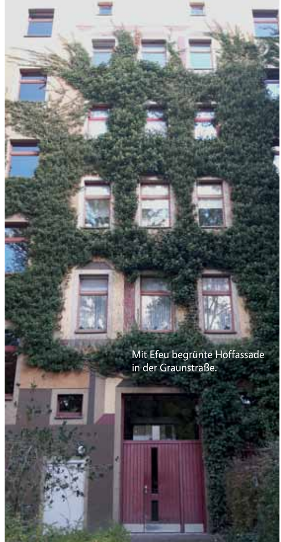
Mit Efeu begrünte Hoffassade in der Graunstraße.

Das Griechische „hedra“, „das, womit oder worauf man sitzt“, bestimmt den botanischen Name für Hedera helix , den Gewöhnlichen Efeu. Mit „helix“ ist möglicherweise die Wulst gemeint, die sich mit der Wurzel zum Beispiel an Bäumen bildet. Dem ausgewählten Baum bleibt der Efeu ein Leben lang treu. Es kommt aber vor, dass ein Baum unter der Last des Efeus umstürzt, wie kürzlich am Dorotheenfriedhof II. Hier hatte der Efeu mit seinem Gewicht eine morsche Birke zu Fall gebracht. Dabei wurde der Friedhofszaun beschädigt