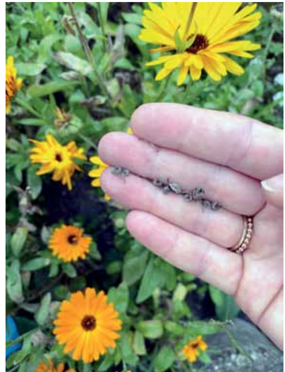
Rechts unten: Die Samen der Ringelblumen sorgen für viele leuchtende Blüten im kommenden Frühjahr.