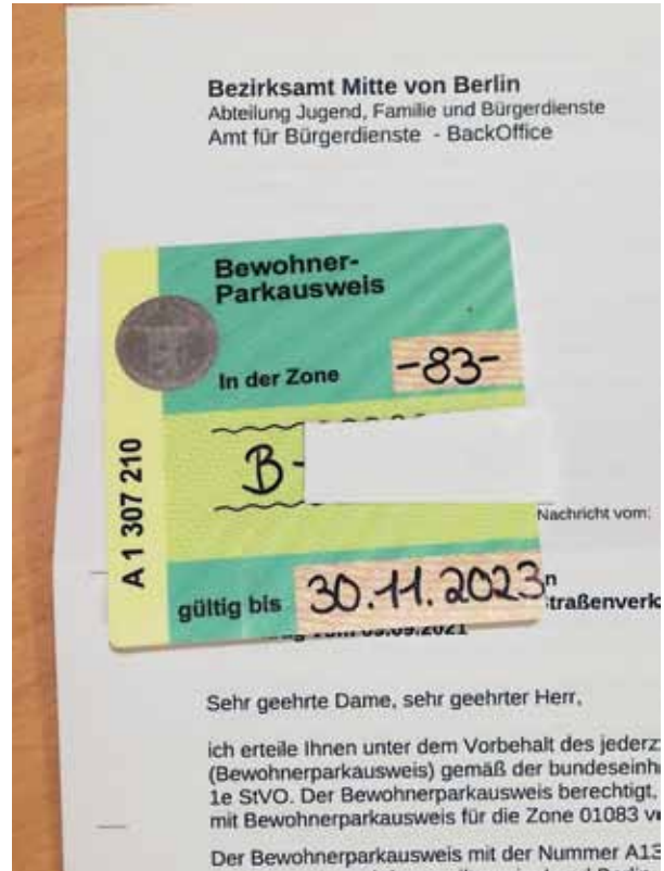
Post vom Bezirksamts mit dem Bewohner-Parkausweis.

Gäste von Anwohnern, Handwerker, Schwerbehinderte und in besonderen Fällen auch Berufspendler können ebenfalls Ausnahmegenehmigungen und beson-