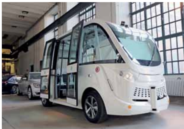
Im Versuchszentrum der TU Berlin im Brunnenviertel.

Das vollständig autonome Fahren steht noch am Anfang. Die Busse auf dem AEG-Gelände brauchen die Forscher nur für eine sehr kleine Frage. Sie wollen wissen, wie ein Computerprogramm den Motor und die Lenkung steuern muss. Sie sagen, sie wollen die Ansteuerung verstehen. Für ihre Arbeit reicht es ihnen, den Bus manuell mit einer Fernbedienung in der Halle fahren zu lassen. Eigentlich wollen die Forscher es irgendwann einmal schaffen, dass die KI auf Fußgänger