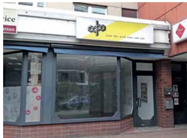
Einer der Kunsträume im Kiez: die Galerie oqbo.