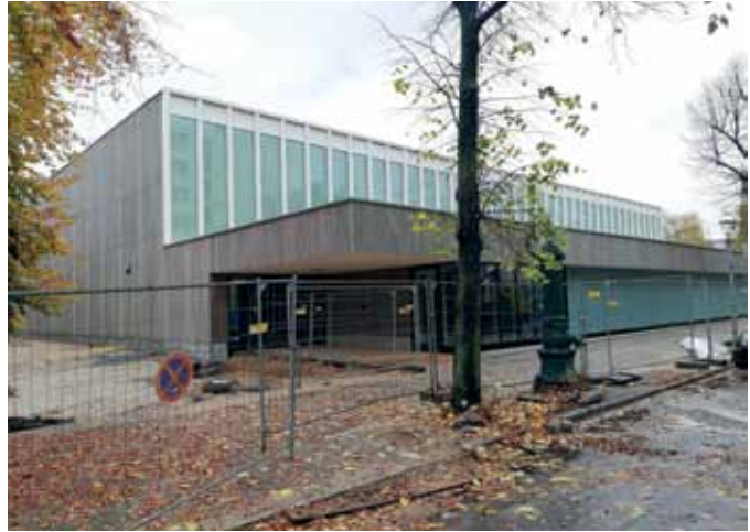
Die neue Sporthalle ist bis auf die Außenanlagen fertig (5. November 2021).

Im Juni 2020 war Baubeginn für die neue Dreifelder-Sporthalle, nun rückt die Fertigstellung in greifbare Nähe. Die Bauabnahme Mitte Oktober hat gezeigt, ein paar Kleinigkeiten müssen noch nachgebessert werden. Noch vor dem Winter soll die Halle an der Putbusser Straße/Ecke Lortzingstraße eröffnet werden. Auch wenn es jetzt noch ein paar Tage dauert: Das sportliche Brunnenviertel ist aufgeregt.