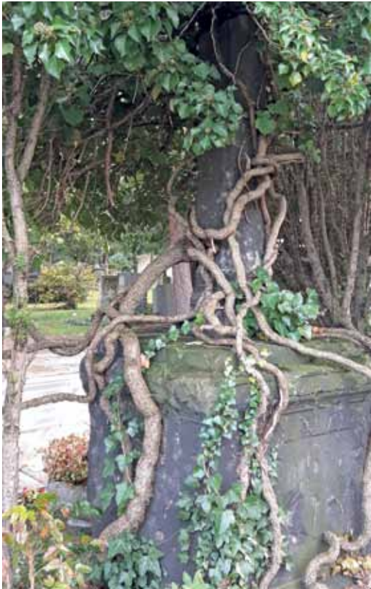
Efeuwurzeln auf dem St. Hedwig-Friedhof in der Liesenstraße.

gepasst. Die ursprünglich tropische Efeupflanze kann auch an Hauswänden emporklettern und schafft dabei locker zwanzig Meter. Ich gehe in der Swinemünder Straße durch die Toreinfahrt und finde an der Rückseite des Hauses ein wahres Efeuparadies.