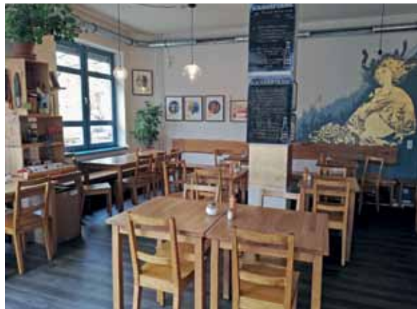
Beliebtes Café mit Mittagstisch: das Café Freysinn.

In ihrer Ablehnung von bestimmten Geschäften sind sich die Mitglieder der Bürgerredaktion relativ einig. Sie wählten verschiedene Bezeichnungen, meinten aber alle das gleiche. Die Wettbüros, Casinos, Spielhallen, Spielotheken tragen nichts für den Kiez bei und sollten ihrer Meinung nach schließen. Für manche gibt es zu viele Friseurateliers im Brunnenviertel, andere mögen die Spätis nicht, wieder andere wünschten sich, dass die Shisha-Bars aus dem Kiez verschwinden. Die mehrfach geäußerte Kritik am Weinhändler in der Wattstraße Ecke Usedomer Stra-