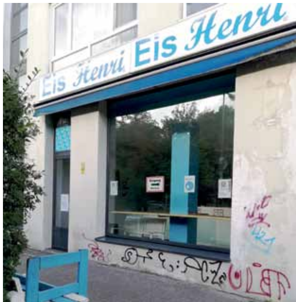
Eis Henri in der Brunnenstraße musste im Oktober wegen einer Mieterhöhung schließen.

Erzählen kann der Eismann, dass er 15 Jahre lang in der Brunnenstraße gearbeitet hat. Zu Beginn führte er den Laden zusammen mit einem Partner. Der letzte Mietvertrag stammt aus dem Jahr 2011.