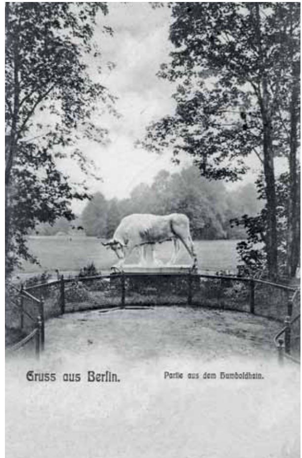
Der weiße Stier vom Humboldthain auf einer Postkarte von 1906.