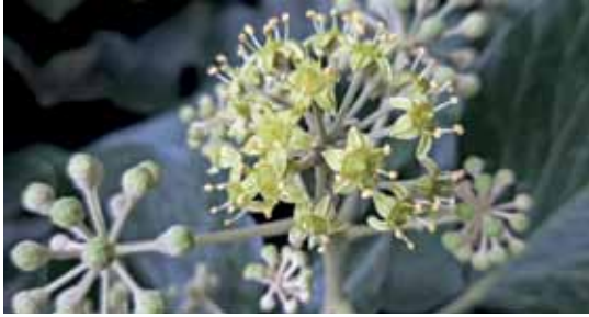
Die in Dolden angeordneten Efeublüten bieten im Herbst Nahrung für Insekten.