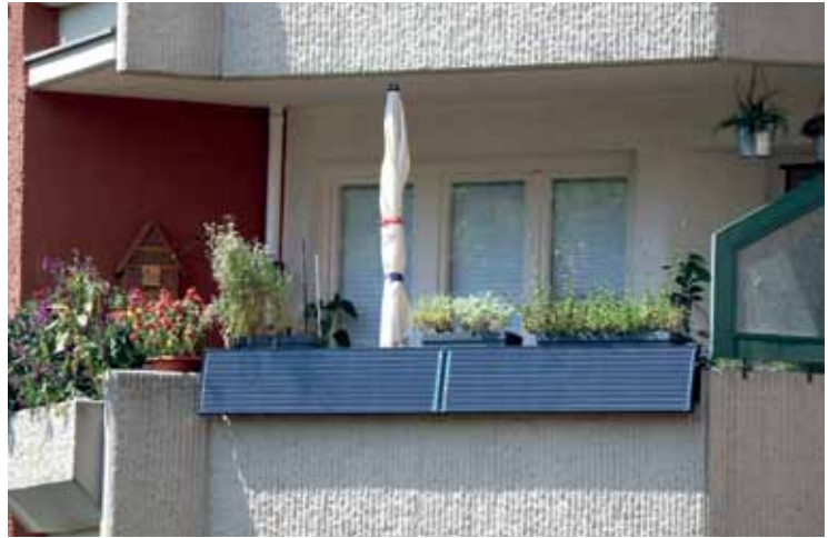
Ein private Balkonsolaranlage im Brunnenviertel in einem Haus des Wohnungsunternehmens degewo.