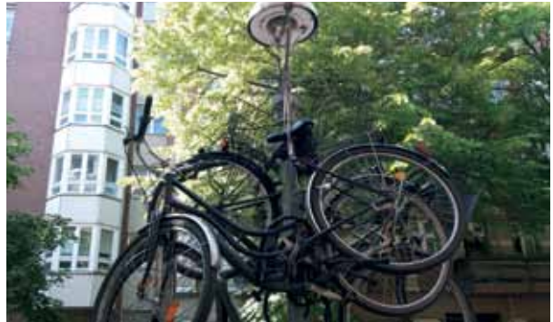
Die angeschlossenen Räder in der Graunstraße wurden für die Bauarbeiten nach oben geschoben.

Brunnenstraße, im Voltakiez, bleiben 98 Gastlaternen als Denkmal erhalten. Dem Engagement von Bürgerinitiativen, die das Gaslicht erhaltenswert finden, sei Dank. An Laternenmasten wird nicht nur für Politik geworben, sondern mit ihnen wird auch Politik gemacht. Daher ist es umso wichtiger zu wissen, was vor der eigenen Haustür passiert.