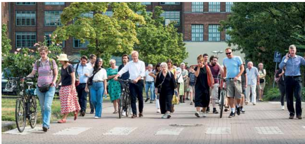
Unterwegs auf dem ehemaligen AEG-Gelände. Hier soll bald das Quartier am Humboldthain mit vielen Gewerbeflächen entstehen.