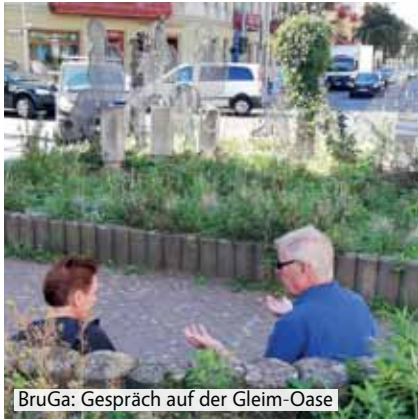
BruGa: Gespräch auf der Gleim-Oase