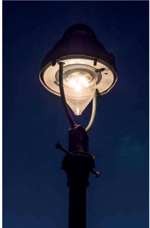
Straßenlaterne, altes Modell im Brunnenviertel.

Die Diskussion um die Gaslaternen läuft schon länger. Als der Berliner Senat vor etwa zehn Jahren begann, sein „Lichtkonzept“ umzusetzen, gab es berlinweit viel Protest. Die Gasreihenleuchten aus den Fünfzigerjahren (sie standen zum Beispiel in der Ackerstraße) sollten durch die Leuchtstoffröhre Jessica ersetzt werden. Ich hatte schon 2013 im damaligen Kiezmagazin brunnen 1/4 darüber berichtet. Damals ging ich aber davon aus, dass uns bei den Gasaufsatzleuchten die gusseisernen Masten erhalten bleiben und die LED-Leuchten den Gasleuchten nachempfunden werden. Das ist aber nur in wenigen Straßen geplant, so in der Strelitzer Straße oder in der Gartenstadt Atlantic nördlich des Bahnhofs Gesundbrunnen. Die heute denkmalgeschützte Gartenstadt entstand in den Zwanzigerjahren, zu einer Zeit, als auch die Gaslaternen mit dem metallenen Aufsatz entwickelt wurden. Diese prägen viele Altbaukieze und stellen mit 20.110 Exemplaren den größten Teil der noch gasbetriebenen Leuchten. Vor zehn Jahren noch beleuchteten in