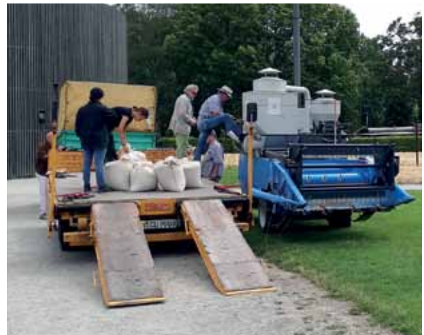
Eindrücke von der Ernte an der Bernauer Straße im Juli 2022.