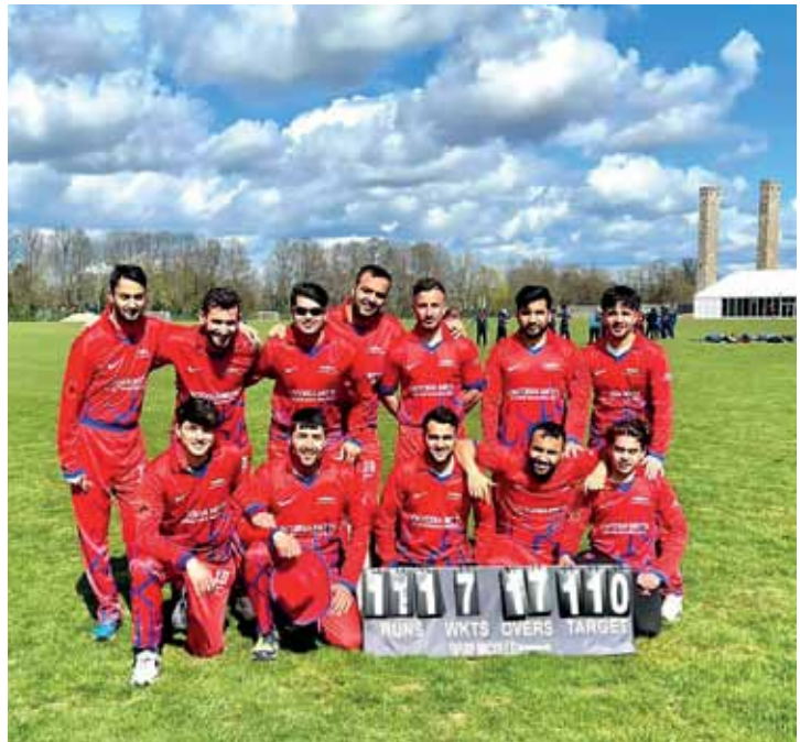
Das Herrenteam von Viktoria Mitte spielt in der Cricket-Bundesliga mit.

Etwa 30 Spieler sind inzwischen Mitglied im Verein. Das Männer-Team spielt in der Bundesliga des