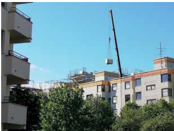
Ein Kran bringt Material für die Sanierung der Wohnhäuser in der Ackerstraße.

Neuerdings gibt es im Handel kleine Balkonsolaranlagen auch für Mieter:innen. Vor Installation ist jedoch das Einverständnis des Vermieters einzuholen.