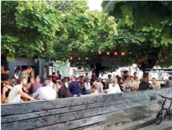
Die Abschiedsparty des „Hirsch & Hase“ Anfang August war richtig gut besucht.