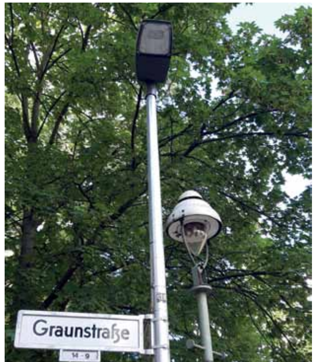
Alte und neue Laterne: Ästhetik versus Funktionalität.

Weitere Informationen zu den Gaslaternen gibt es im Internet unter www.gaslicht-ist-berlin.de oder auf der Seite www.berlin.de/sen/uvk/verkehr/infrastruktur/oeffentliche-beleuchtung/gasbeleuchtung