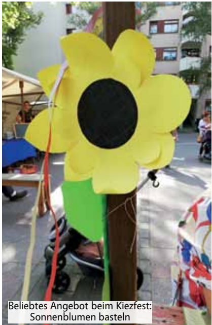
Beliebtes Angebot beim Kiezfest: Sonnenblumen basteln

Schon ein kleiner Foto-Rückblick auf die Brunnenviertel Gartenschau (BruGa) und das Kiezfest zeigt, dass es im Brunnenviertel eine aktive und vielfältige Nachbarschaft gibt. Kiezgärtner:innen öffneten am 3. und 4. September ihre grünen Oasen, am 4. September feierte der Kiez ein buntes Fest mit Musik und Tanz, Waffeln und Pflanzentausch und mit Ständen von vielen Kiezinitiativen am Vinetaplatz. Organisiert wurden beide Veranstaltungen vom Brunnenviertel e.V. Ausführlichere Berichte und mehr Fotos sind unter www.brunnenmagazin.wordpress.com zu finden.