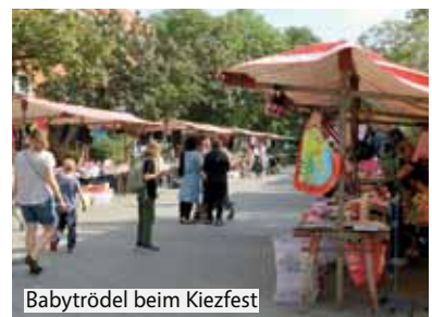
Babytrödel beim Kiezfest