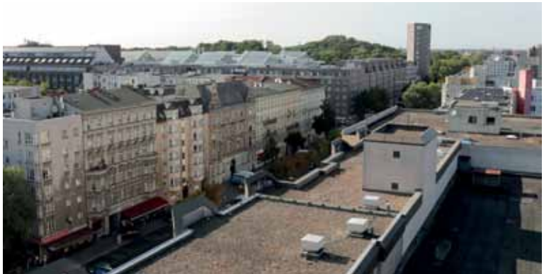
Die Dächer im Brunnenviertel bieten noch viel Platz für Solaranlagen.

Übertragen auf das Brunnenviertel, welches die doppelte Einwohnerzahl der imaginären Kleinstadt aus dem Planspiel hat, würde ich nun möglichst viele Photovoltaikanlagen auf den Dächern errichten, um klimaneu-