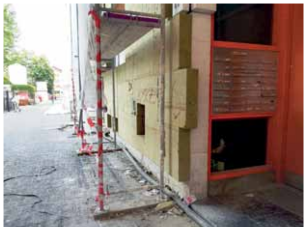
Zu den Sanierungsmaßnahmen der degewo gehörte auch die Dämmung der Fassade. Das spart Energie.