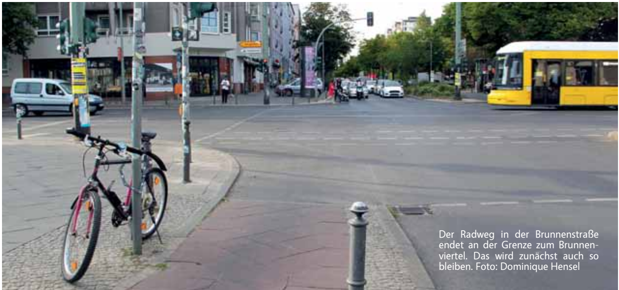
Der Radweg in der Brunnenstraße endet an der Grenze zum Brunnenviertel. Das wird zunächst auch so bleiben.