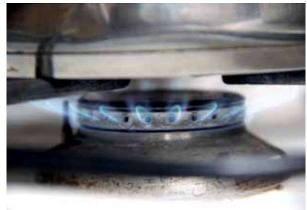
Viele degewo-Mieter:innen im Brunnenviertel haben einen Gasherd. Ein flächendeckender Austausch ist derzeit nicht geplant.