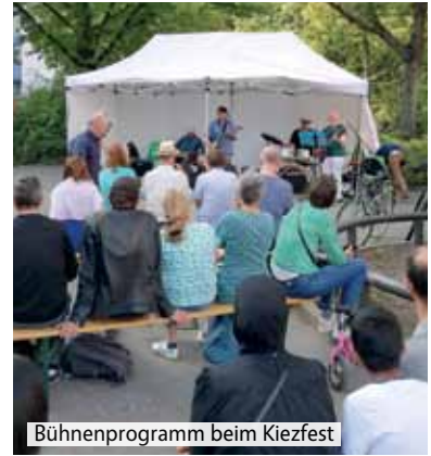
Bühnenprogramm beim Kiezfest