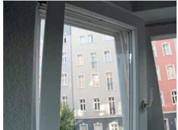
Nicht auf Kipp! Richtiges Lüften in Kombination mit der richtigen Heizungseinstellung kann helfen, viel Energie zu sparen.