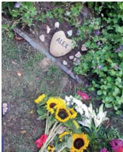
Alex Kochs Grabstelle auf dem Friedhof in der Liesenstraße.

„Er hinterlässt durch sein vielfältiges und kompromissloses Engagement eine Lücke, die nicht zu füllen sein wird“, schreibt der Behindertenbeirat des Bezirks Mitte in seinem Nachruf. „Es waren nicht Zorn oder Verbitterung, die ihn antrieben, sondern Freude am Leben, der Sinn für Demokratie und Gerechtigkeit und die Weigerung, Diskriminierung und Alltagsbarrieren als gegeben hinzunehmen“, heißt es weiter sehr treffend.