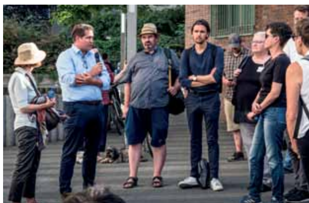
Der Vertreter des Investors Hines beantwortete Fragen zum Kaufland-Gelände.