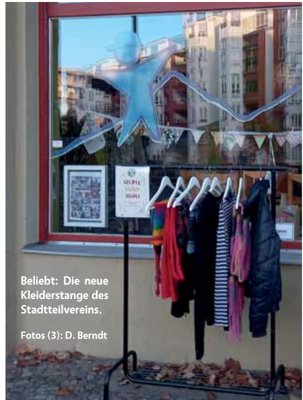
Beliebt: Die neue Kleiderstange des Stadtteilvereins.

Auch wer weder Kleidung reparieren noch tauschen möchte, ist dienstags herzlich willkommen. Von 14 bis 16 Uhr kann die Gelegenheit genutzt werden, auf einen Kaffee oder Tee einzukehren und in gemütlicher Runde zu plauschen. Wer mag, kann gern einen Kuchen mitbringen. Wir haben einen kleinen Fundus an