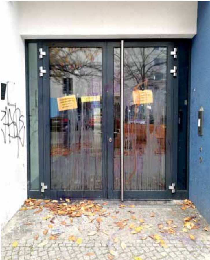
Die Scheiben und die Fassade des Olof-Palme-Zentrums wurden in der Halloweennacht beschmiert und verschmutzt.

Der Brunnenviertel e.V. sowie das Olof-Palme-Zentrum (OPZ) organisierte schon im November 2022 ein Anwohnertreffen. Hier wurde deutlich, dass in einem Radius von zwei Kilometern viele Menschen betroffen waren. An Themen-Tischen wurde über Lösungen nachgedacht, jeder konnte Vorschläge machen. Auch ein Brandbrief an den Berliner Senat war im Gespräch. Die Silvesternacht hat einmal mehr gezeigt, dass es ist nicht nur ein Problem in unserem Kiez ist, Übergriffe auf Polizei und Feuerwehr kommen auch immer wieder vor. Den Einsatzkräften wird ganz klar keinerlei Respekt mehr entgegengebracht.