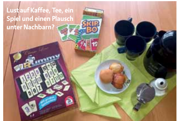
Lust auf Kaffee, Tee, ein Spiel und einen Plausch unter Nachbarn?