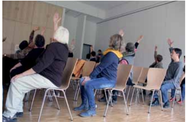
Bei einer Veranstaltung für ältere Menschen.

Auch wenn einiges noch holprig und in der Zeit der Umstrukturierung mit einem enormen Kraftakt für die Mitarbeitenden verbunden ist, da so viele Dinge unter einen Hut gebracht werden müssen, sehen wir schon jetzt, wie das Haus an Lebendigkeit und Austausch gewinnt. Dazu trägt glücklicherweise auch die Behebung des extremen Personalmangels bei, ebenso wie die Neubesetzung der Leitungsstelle des Kinder- und Jugendbereiches im OPZ und das Ende der Pandemie.