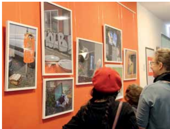
Schattentheater für Kinder und Familien im Garten. Rechts: Ausstellungseröffnung an der roten Galeriewand.