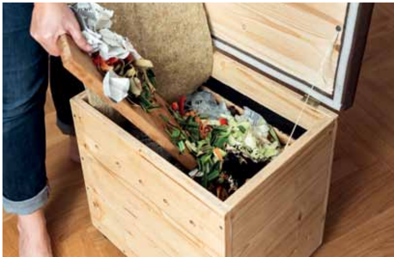
Viele Bioabfälle können in die Wurmbox.

Wurmhumus entsteht beim Verdauungsvorgang der Kompostwürmer, der Eisenia fetida . Sie sind besondere Feinschmecker und da sie keine Zähne haben, lassen sie sich die Bioreste zunächst „vorkauen“. Kartoffel- oder Karottenschalen werden von Kleinstlebewesen zersetzt, und dann von den Würmern aufgesogen und verdaut. Mehr über Kompostwürmer, die zur