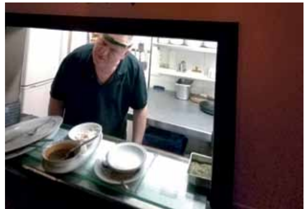
Guten Appetit!