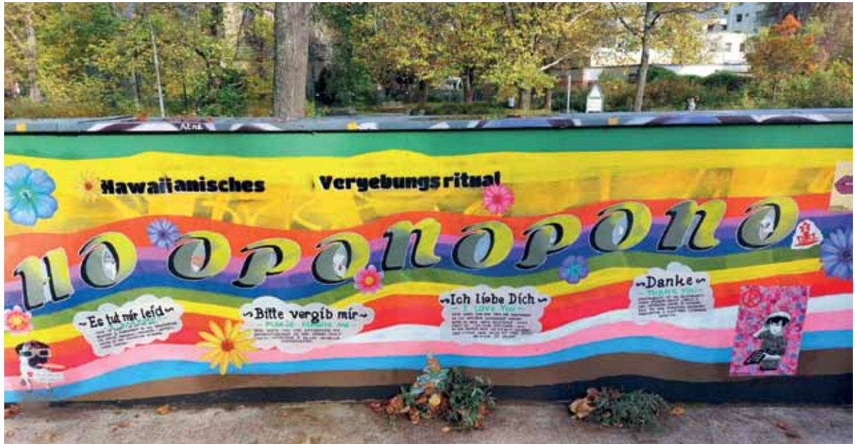
Vor Kurzem gab es ein Graffito in der „North Side Gallery“ im Nordbahnhofpark, das das hawaiianische Ritual thematisierte. Inzwischen ist es schon wieder übermalt, aber mit dem Foto wurde es von unserer Autorin festgehalten.