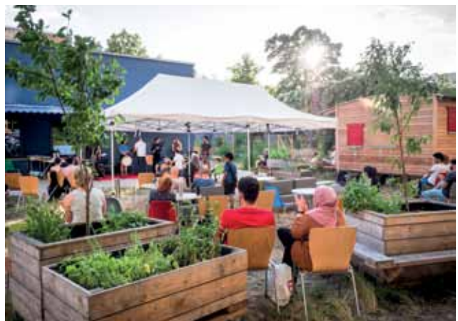
Ein Fest für alle Generationen: Fête de la Musique im Garten des Olof-Palme-Zentrums vor zwei Jahren.