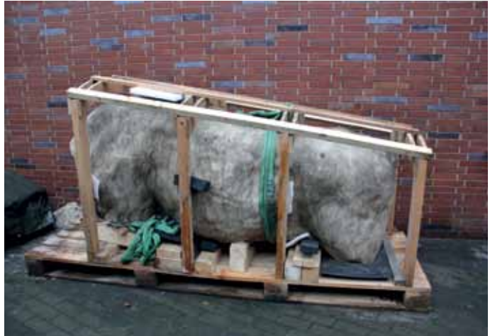
Der Torso der Stierskulptur wird derzeit beim Berliner Unterwelten e.V. gelagert.

Mitte Februar jedoch wurde die beschädigte Marmorskulptur von Ernst Moritz Geyger trotz der noch ungewissen Zukunft am Gesundbrunnen verladen und einmal um den Humboldthain herumgefahren.