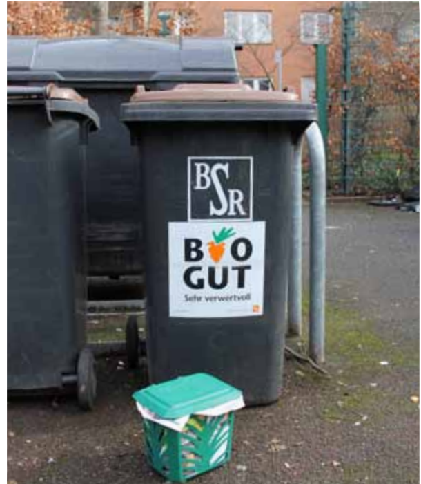
Auch eine gute Lösung: Der Inhalt der Biotonnen wird in Berlin Ruhleben zu Biogas.

Ich will natürlich alles richtig machen und werde die Wurmbox zunächst noch nicht bestellen. Meine Bioabfälle bringe ich wie bisher in die Biotonne, für