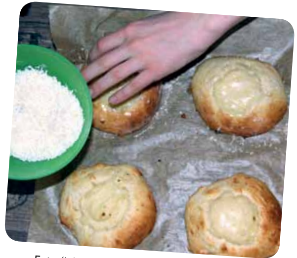
Foto (Jakob Hensel/Koch): Menzy Menzales Alle anderen Fotos: D. Hensel