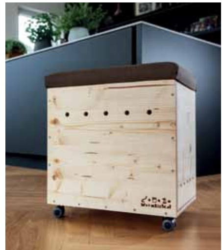
Wurmhumus für die Jostabeeren. Rechts: Wurmbox mit Sitzkissen.