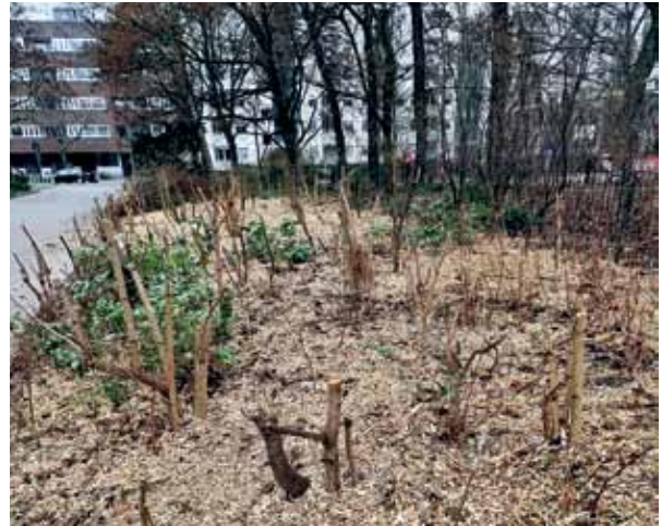
Nach der Grünpflege am Vinetaplatz.

Rückschnitt für zu drastisch und deshalb schlecht für brütende Vögel hält. Mit einem Brief hat er sich an die zuständige Stadträtin im Bezirksamt gewendet. Hier sind der Brief und die Antwort.