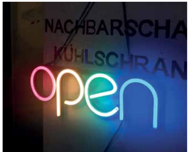
Leuchtschild am Nachbarschaftskühlschrank. In dem sogenannten Fairtainer können Lebensmittel getauscht werden.