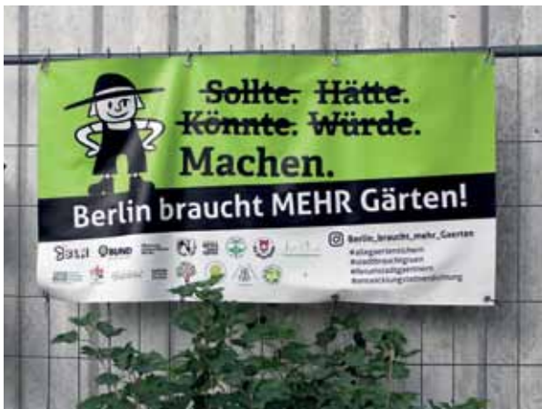
Ein Plakat des Netzwerks Urbane Gärten Berlin.

Der Text wurde von unserem Kooperationspartner www.weddingweiser.de zur Verfügung gestellt. Danke!