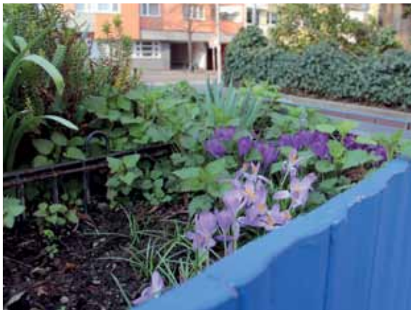
Die Blumenkübel am Vinetaplatz waren 2012 das erste Urban Gardening-Projekt im öffentlichen Raum im Kiez; es gibt sie bis heute.