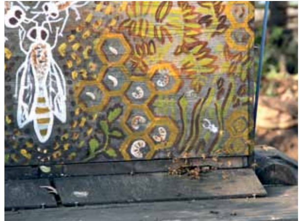
Die Bienen im Gemeinschaftsgarten Mauergarten sind bei sonnigem warmen Wetter aktiv.