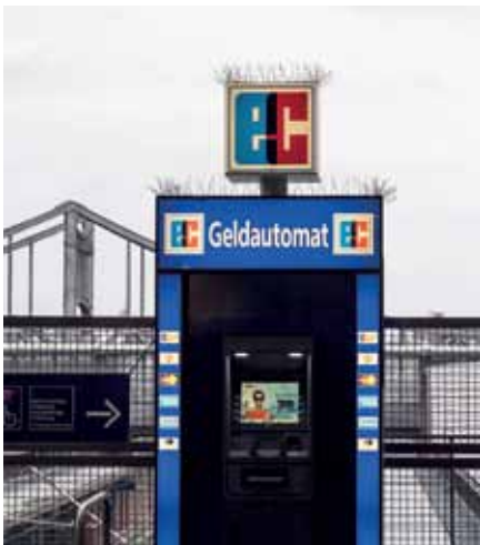
Eine Verletzungsgefahr: Geldautomat am Gesundbrunnen mit Spikes zur Taubenabwehr.

Schnell weg mit ihnen, ist mein erster Gedanke. Im Internet forsche ich nach Möglichkeiten, die Tauben loszuwerden. Ich will es auf sanfte Weise versuchen, verbreite Essiggeruch, stelle Windräder auf, mache mich mit Geräuschen bemerkbar. Alles hilft nur für kurze Zeit.