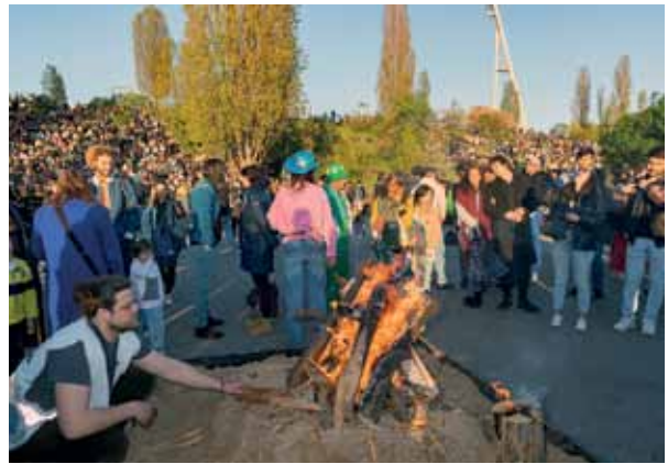
Die Walpurgisnacht im Mauerpark ist ein buntes Fest mit vielen kleinen und großen Aktionen wie Jonglage und Lagerfeuer.