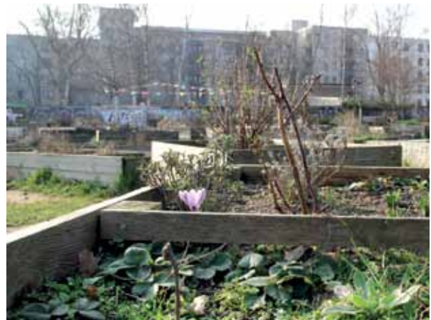
Der Mauergarten wurde 2013 als Gemeinschaftsgarten im Brunnenviertel gegründet. Wegen eines Gebietstauschs liegt er heute in Pankow.