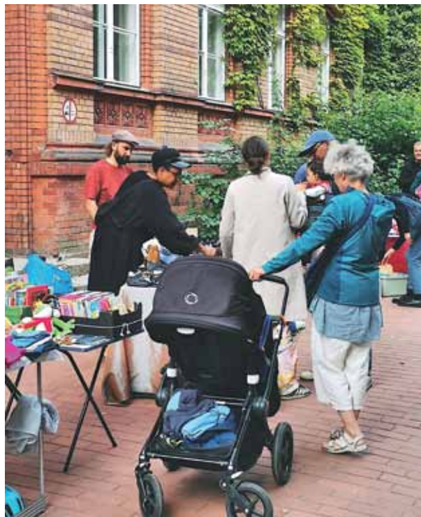
Weiterreich-Flohmarkt in der Demminer Straße 27.

takte mit den Verkäufern, für den Auf- und Abbau lediglich eines Standes (den für Kaffee und Kuchen), für das Abholen der nötigen Schlüssel. Das Thema Zeit bringt mich auf das Thema Zeitpunkt. Wann ist der perfekte Termin für einen Flohmarkt? Die Verkäuferinnen gaben mir Tipps. Achte auf die großen, wichtigen Termine: Berlin-Marathon, Kinderflohmarkt Tegel, Brückentage. Und auf den Volkstrauertag. An dem Tag darf es keine Flohmärkte geben. Das waren hilfreiche Gespräche. Als Mythos hat sich dagegen erwiesen,