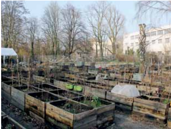
Hochbeete im Gemeinschaftsgarten Himmelbeet. Die Saison beginnt jetzt, neue Beetpächter:innen sind willkommen.