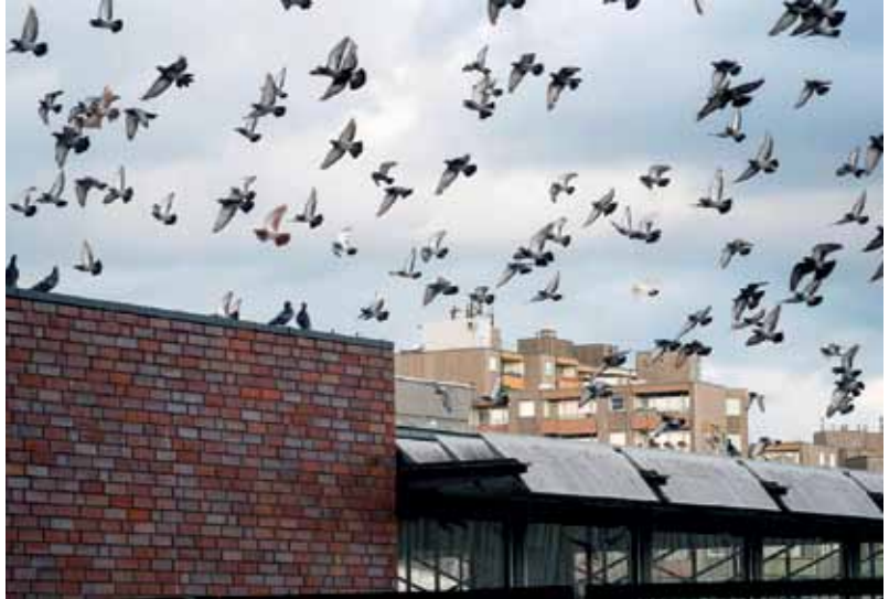
Ein Taubenschwarm am Bahnhof Gesundbrunnen.