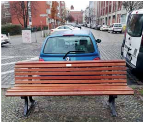
Eine neue Bank in der Stralsunder Straße. Unten: der Spruch, der auf der Bank angebracht ist. Von wem stammt er?

versehen wurden (siehe Foto). Woher diese Schilder kommen, weiß das Bezirksamt nicht. Es ist wohl eine private Initiative aus dem Kiez, die hier aktiv war.