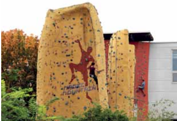
Außenbereich der Kletterhalle Magic Mountain in der Böttgerstraße.

--> Kletterhalle Magic Mountain, Infos sowie Öffnungszeiten: www.magicmountain.de