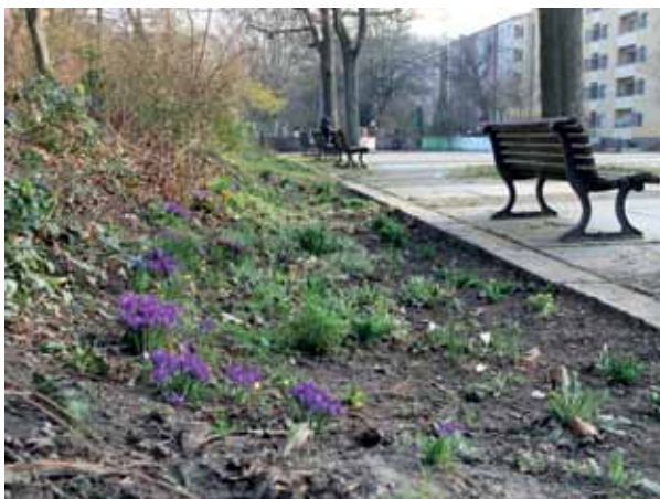
Die Krokusse auf dem Vinetaplatz wurden durch Anwohner:innen am Rande einer Putzaktion im Jahr 2018 gesteckt.