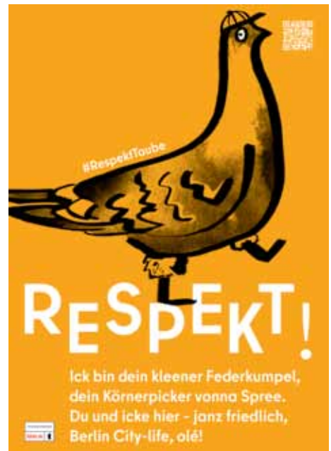
Ein Plakat der Kampagne #RespektTaube der Tierschutzbeauftragten des Landes Berlin.