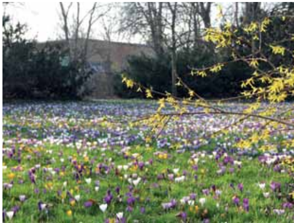
Die Krokuswiese im Humboldthain nahe dem Parkeingang in der Wiesenstraße war auch in diesem Jahr eine Frühlingsfreude.