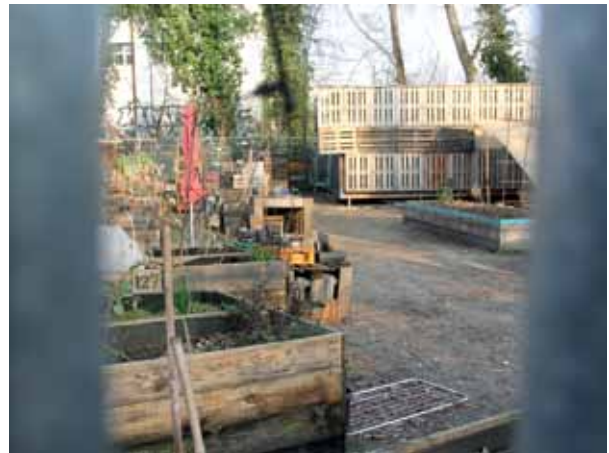
Noch neu am Kiez: Der Gemeinschaftsgarten Himmelbeet in der Gartenstraße ist 2022 an die Liesenbrücken gezogen.