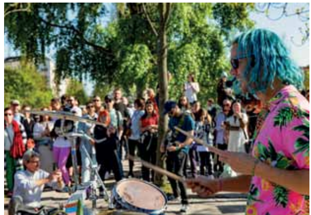
Feuerjonglage und Konzerte gehören auch zum Programm des Festes, das in diesem Jahr zum 18. Mal stattfindet.