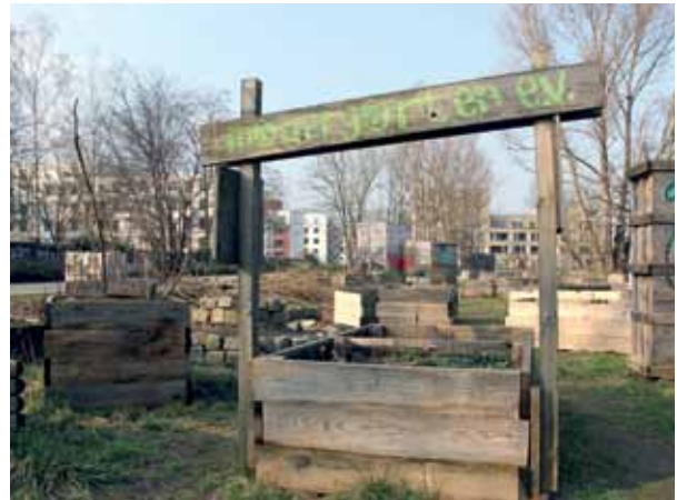
Im Mauergarten im Mauerpark entstehen auch in diesem Jahr wieder neue Hochbeete, Neugärtner:innen können noch dazukommen.

Vor zwei Jahren hat das Brunnenviertel einen weiteren Gemeinschaftsgarten bekommen. Das Himmelbeet in der Gartenstraße hat sich inzwischen schon gut am neuen Standort eingerichtet. Wer die Gemeinschaft weiter komplettieren möchte, kann zum Beispiel ein Pachtbeet mieten ( pachtbeete@himmelbeet.de ). Die Mitmachtage im Garten haben bereits begonnen, sie finden ab jetzt regelmäßig mittwochs statt (14–17 Uhr). Mehr dazu steht auf www.himmelbeet.de . Dort sind auch weitere Termine zu finden, unter anderem für Workshops, das Sprachcafé oder Pflanzenmärkte. Am 20. April ist zum Beispiel ein Frühlingsfest mit Workshops, Musik, Gartenführung und Kulinarischem geplant. Für diese Saison hat sich das Gartenteam vorgenommen, alle Vorbereitungen zu treffen, um das Gartencafé wieder zu eröffnen. Das war am alten Gartenstandort in der Ruheplatzstraße ein wichtiger Anziehungspunkt.