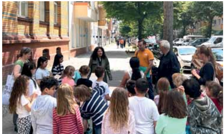
Begrünungsprojekt an der Leo-Lionni-Schule.

Die Bürgerprojekte haben auch weitere institutionelle Partner. So gibt es Kooperationen mit dem Olaf-Palme-Zentrum, dem Nachbarschaftstreff Waschküche, dem +60 in Freundschaft Wohnen e.V., dem Gemeinschaftsgarten Niemand's Land, dem Brunnenviertel e.V., Familienzentrum Wattstraße, dem Essbare Straße e.V., dem Gemeinschaftsgarten Himmelbeet, dem Caiju e.V. und dem Europäischen Energie- und Umweltforum e.V.