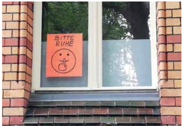
Psst! Das Hinweisschild in der Strelitzer Straße bittet um Ruhe.

So könnten die beiden Bekannten auf der Brunnenstraße mit etwas mehr innerer und äußerer Ruhe ein bereicherndes Gespräch führen, anstatt gestresst weiterzueilen. Frei nach dem Motto: „Jetzt unterhalte ich mich.“