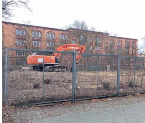
Ein Bagger hat die Baufläche vorbereitet. Bäume, Büsche und Spielgeräte wurden auf dem einstigen Spielplatz entfernt.

Auf dem Eckgrundstück Strelitzer und Stralsunder Straße haben Mitte Februar bauvorbereitende Arbeiten begonnen. Auf dem Grundstück soll laut dem Bezirksamt Mitte ein Modularer Erweiterungsbau (MEB) für die Gustav-Falke-Grundschule entstehen. Der Erweiterungsbau werde ein sogenannter MEB 22. Das bedeutet, dass der neue Schulbau 22 Klassenräume haben wird. Wie aus Dokumenten der Senatsverwaltung für Bildung, Jugend und Familie hervorgeht, wird der Finanzbedarf jetzt auf fast 17 Millionen Euro geschätzt. Mit der Fertigstellung und Inbetriebnahme wird laut Senatsverwaltung zum Ende des 3. Quartals 2026 gerechnet. Die Errichtung des MEB steht schon länger in der Planung der Schulbauoffensive des Berliner Senats. Eigentlich sollte der Bau 2018 entstehen. Die Maßnahme wurde dann aber zurückgestellt. Nun startet die Erweiterung der Grundschule mit gebundenem Ganztagsbetrieb.