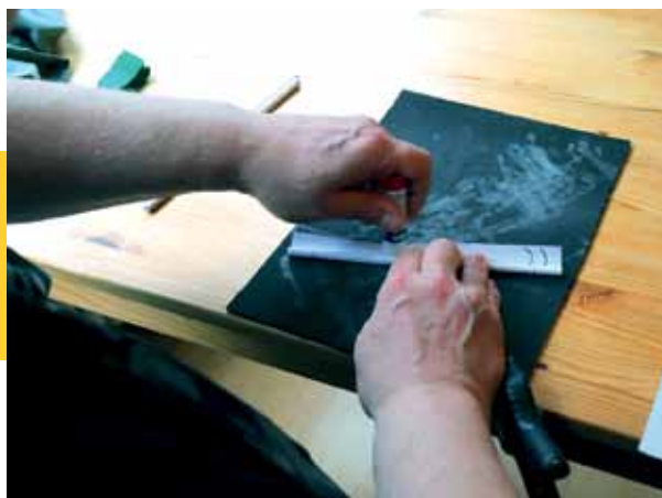
Zum Schluss wird das Papier verklebt. -->