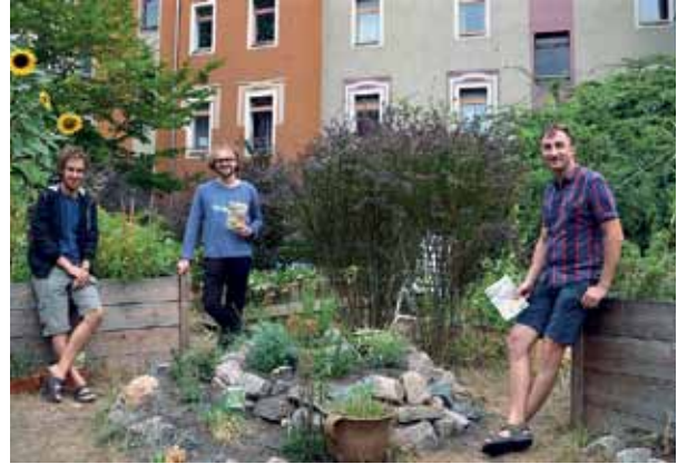
Der Elstergarten bei der BruGa 2018.

Am Sonntag, den 18. Mai steht die geführte Radtour auf dem Programm. Wer die gesamte Führung mitmachen möchte, startet um 11 Uhr vor dem Vereinsraum des Brunnenviertel e.V. und radelt bis 15 Uhr mit. Zahlreiche Pausen sind an den jeweiligen Stationen eingeplant. Wem die Hälfte der Zeit ausreicht, der kann zur Halbzeit um 13 Uhr aus der Tour aus- oder in sie einsteigen. Zum Abschluss der BruGa wird am Sonntag um 16 Uhr in der Kirche am Humboldtthain ein Chor singen. Teilnehmende Gärten sind unter anderem das Diesterbeet (voraussichtlich mit