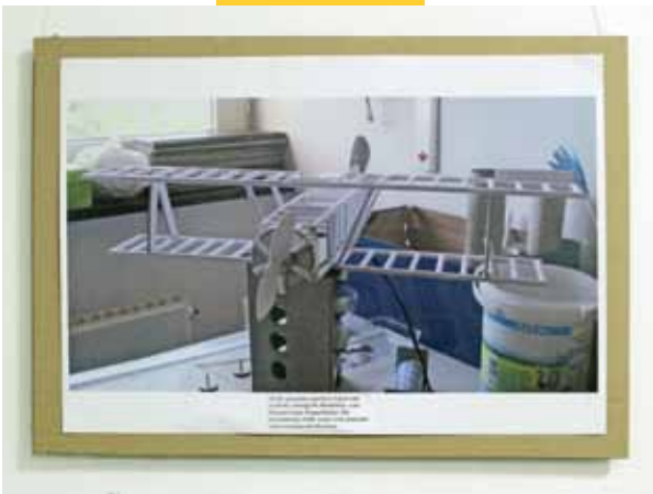
Aus Bastelstäben gebauter Doppeldecker.