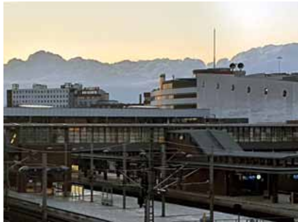
Blick auf den Gesundbrunnen mit Wolkengebirge.

Nichts fällt mir heute auf! Kein Wunder, keine Begegnung, kein Zwischenfall, der meinen inneren Ideomotor anwirft, ein ganz normaler Gang zur U-Bahn, am Kaufland vorbei, schau mal, ein Vögelchen, ich beobachte den vorbeifahrenden Zug nach Stralsund, einsteigen bitte, ein Fernzuggleis, alles um mich herum in Bewegung. Die Phantasie ist ein ewiger Frühling sagte angeblich Friedrich Schiller, aber es gibt keinen einzigen Beleg in den zahlreichen Zitatesammlungen, der mit diesem zugegebenermaßen anregenden Zitat hausieren gehen kann. Eine Heilquelle wurde hier einst entdeckt und eine ganze Badeheilstätte gegründet, an die noch der Name Gesundbrunnen erinnert. Diese Quelle versiegte. Da war der Wurm drin! Das Berliner Heilwasser, das heilende Wasser, muss aber doch noch irgendwo da unten sein? Dieser Wurm, also entweder fange ich ihn heute oder er ist halt drin. Was ist das für ein Wurm, da wieder, eine leere Lachgasflasche im Hawaii-Fruity-Look, ich