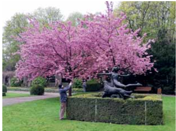
Ein Spaziergang im Park ist eine gute Möglichkeit, zur Ruhe zu kommen.

Das Hier und Jetzt ist der Punkt, an dem wir aus der Stress-Spirale aussteigen können. Nur in der Gegenwart ist es möglich, Stopp zu all den Aufgaben, Menschen und eigenen Gedanken zu sagen, die uns den letzten Nerv kosten.