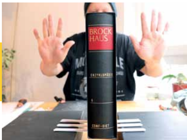
Diese Bastelstäbe sind erstaunlich stabil.