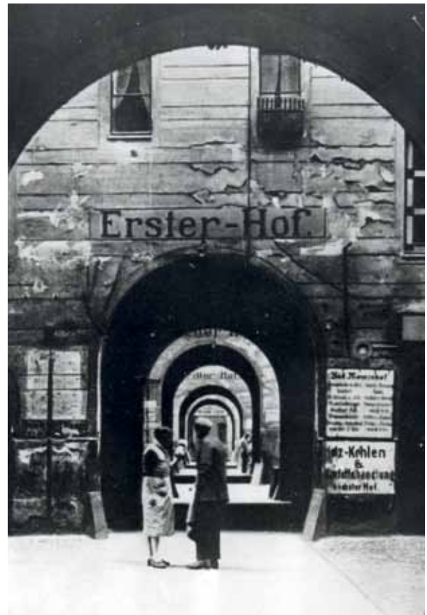
Die Mietskasernen „Meyers-Hof“ in der Ackerstraße 132–133 galt als Synonym für Elend und Verfall. In den sechs Gebäuden hausten zeitweise bis zu 2.000 Menschen.

Wer neugierig geworden ist, behält den Filmtitel vielleicht im Kopf. Vielleicht läuft dieses Meisterwerk deutscher Stummfilm-Geschichte wieder einmal im Kino Babylon – mit dem Jazzpianisten Ekkehard Wölk live am Klavier?