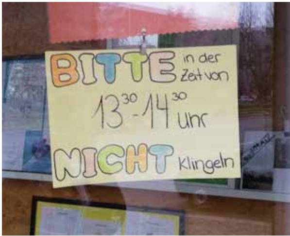
Für äußere Ruhe sorgen: hier mit einem Schild an einem Wohnhaus, in der eine Kita ist.