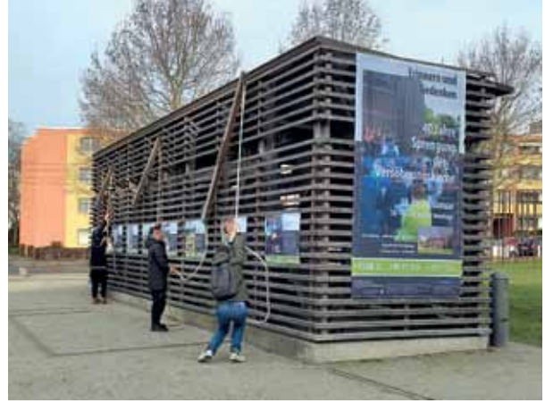
Die Glocken der alten Versöhnungskirche werden von Hand geläutet. Am Glockenstuhl hängt nun auch die Ausstellung zur Kirchensprengung.