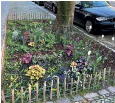
Bepflanzte Baumscheibe in der Usedomer Straße.

In der Usedomer Straße/Wattstraße wurden im April 2023 Mieterpatenschaften für sieben Bäume gebildet. Die Paten bepflanzen und pflegen seitdem die Baumscheiben. Im Sommer 2024 wurde für Eltern und Kleinkinder „Pflanzen und Gießen zum Alltag“ – mithilfe eines angeschafften Gießwagens.