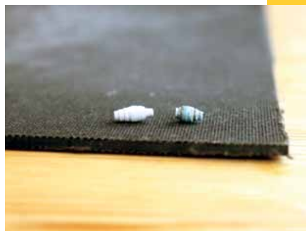
Fertig sind die Papierperlen.