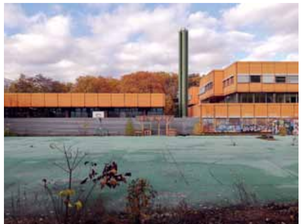
Auf dem ehemaligen Sportplatz soll der Ersatzbau entstehen.

Die Ernst-Reuter-Schule in der Stralsunder Straße wartet schon seit vielen Jahren auf ihre dringende Sanierung. Nun haben erste Vermessungsarbeiten begonnen. Doch zunächst muss ein Ausweichquartier für die Schule mit 1000 Schülerinnen und Schülern errichtet werden. Diese Ersatzschule soll ab dem 4. Quartal 2025 auf dem ehemaligen Sportplatz neben dem leerstehenden Oberstufenzentrum Wedding (Diesterweg-Gymnasium) in der Putbusser Straße entstehen. Ab 2026 sollen bis zu 600 Schüler in dem behelfsmäßigen Modulbau mit drei Etagen lernen. Bis 2031 soll die Ernst-Reuter-Schule in der Stralsunder Straße saniert sein, so das Bezirksamt Mitte. Finanziert werden beiden Maßnahmen aus der Schulbauoffensive – zusammen sind das über 150 Millionen Euro.