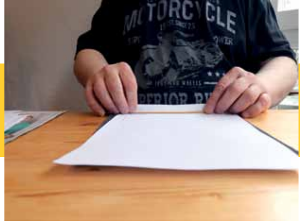
Dieser Spieß wird fest in Papier eingewickelt... -->