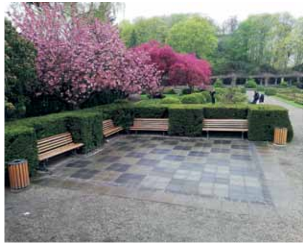
Zu Ruhe kommen kann man auch, wenn man sich auf eine Bank im Rosengarten im Humboldthain setzt.