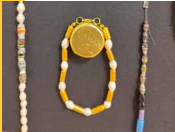
Aus den Papierperlen lässt sich hübscher Schmuck herstellen.