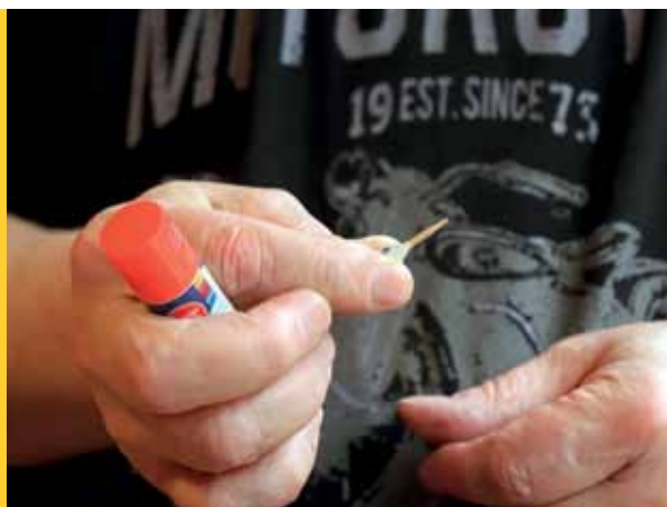
Fest um einen Zahnstocher wickeln, mit Kleber fixieren...