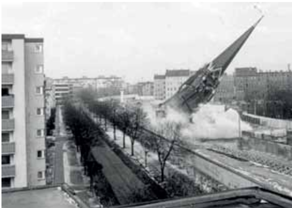
22. Januar 1985: Die Versöhnungskirche wird gesprengt.

Wer sich über diesen Teil der Geschichte informieren möchte, kann die Ausstellung am Glockenstuhl der Kapelle der Versöhnung (noch bis Mai) besuchen.