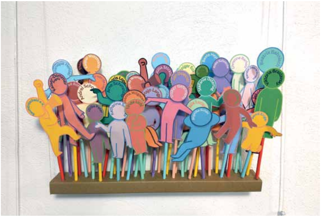
Aus der Ausstellung „Kiezschreiber – Zehn Jahre Bürgerredaktion“. Jedes stilisierte Männchen steht für eine Person, die ehrenamtlich in der Bürgerredaktion im Brunnenviertel mitgemacht hat.