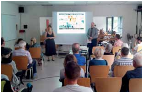
Beim Lichtbildervortrag über die Bernauer Straße im Olof-Palme-Zentrum am 21. September 2025.

Ich hoffe sehr, dass es auch weiterhin die gedruckten Kiezmagazine geben wird, denn es ist noch einiges im Brunnenviertel zu entdecken. Für die stets gute Zusammenarbeit danke ich Dominique Hensel sowie dem gesamten Team des Magazins.