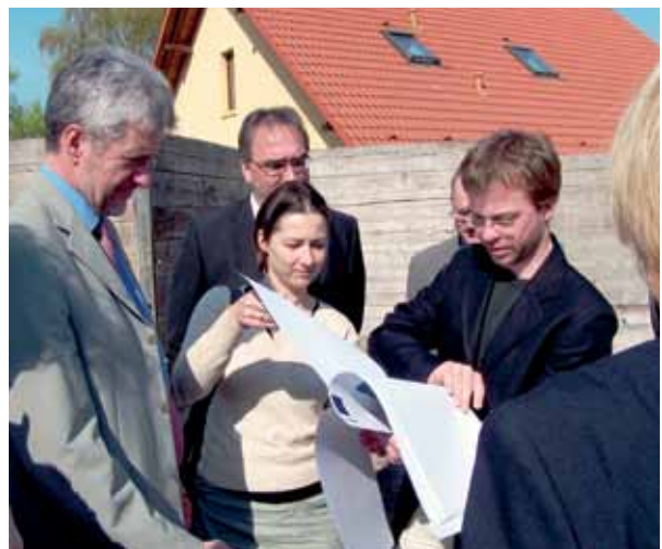
Hier rede ich in Strausberg mit dem brandenburgischen Bildungsminister, dem Bürgermeister und unseren Architekten, die gerade ein Haus für die Freie Schule umgebaut haben. Wir schauen die Pläne an. Ich denke, es war 2004.

Was mache ich als nächstes? Dazu mache ich natürlich keine Angaben. Sicher ist: Ich werde es tun. Ich mache es gern und ich kann einfach nicht anders. ;)