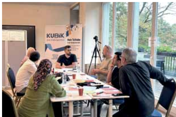
Teilnehmerinnen und Teilnehmer bei zwei Seminaren im Projekt „Mehr Teilhabe in der Stadtgesellschaft“.