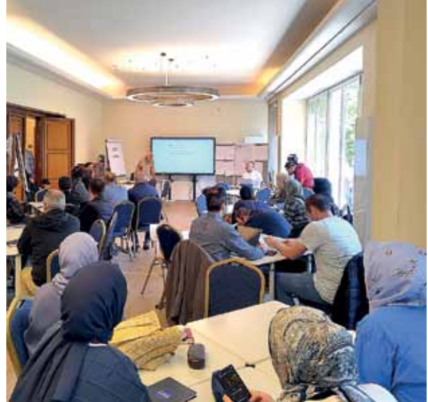
Bei den Seminaren wurden auch die Unterschiede beim Ehrenamt in der Türkei und in Deutschland besprochen.

Mit der Zeit erkannte ich, dass daraus ein Teufelskreis entstand: Unsichtbare Hilfen können sich nicht vermehren. Wie eng dieser Kreis in sich geschlossen war, wurde mir erst bewusst, als ich nach Deutschland kam. Hier hatte das Ehrenamt beinahe den Charakter einer bürgerlichen Pflicht. Sich in Vereinen, Jugendprojekten, Migrantenorganisationen, Seniorenzentren oder Nachbarschaftsinitiativen zu engagieren, war nicht nur erwünscht, sondern ein sichtbarer Bestandteil des öffentlichen Lebens. Menschen erzählten offen von ihrem Engagement, luden andere ein und machten damit das Ehrenamt zu einem gesellschaftlichen Wert, der im Alltag präsent war.