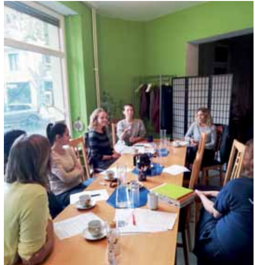
Austausch über Berufe im Freizeiteck.

Der Brunnenviertel e.V. führt das Projekt zusammen mit dem Kollektiv Janainas durch. Gefördert wird es von der Stiftung Pfefferberg. Insgesamt vier Austauschseminare werden sind