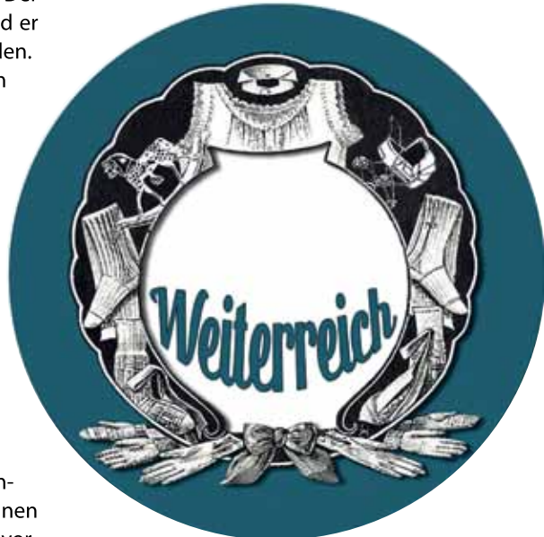
Das Logo des neuen Flohmarkts. Grafik: Sulamith Sallmann

Informationen zum neuen Flohmarkt gibt es auf der Webseite www.weiterreich.de . Auch unter www.facebook.com/weiterreich werden regelmäßig Neuigkeiten geteilt. Per E-Mail via flohmarkt@brunnenviertel.de oder telefonisch unter (0157) 37 64 40 65 können Interessierte einen kostenlosen Stand für den ersten und die folgenden Flohmarkttermine anmelden.