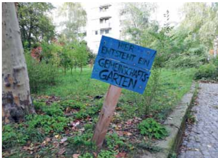
Von der Redaktion dieses Mal nicht genannt, aber im Kiez trotzdem oft gewünscht: neue Pflanzmöglichkeiten für Nachbarn in der Stralsunder Straße.

Ich wünsche mir, dass die Innenhöfe idyllische Orte für die Bewohner sind: naturnahe und grüne Oasen inmitten der Stadt. Dazu gehören Sitzbänke, die im Sommer mit Sonnensegeln geschützt sind. Auch ein kleiner Springbrunnen in jedem Hof, der ein angenehmes Klima schafft, wäre toll. An dem könnten auch Vögel