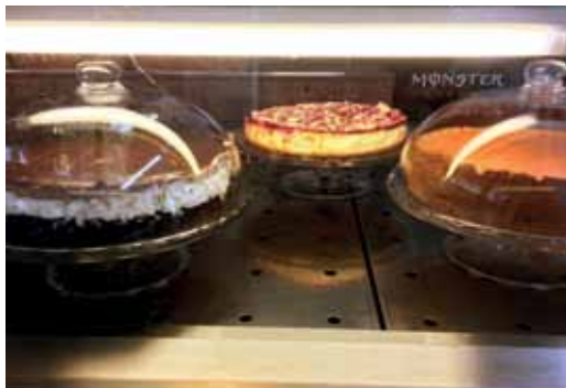
„Herzlich Willkommen“ steht auf dem Schild mit den Getränken. In der Vitrine: selbstgemachte Kuchen.

*Jochen Uhländer ist Stadtteilkoordinator im Gebiet Brunnenstraße Nord. Sein Büro hat er im Olof-Palme-Zentrum. Dies ist sein erster Beitrag im Kiezmagazin.