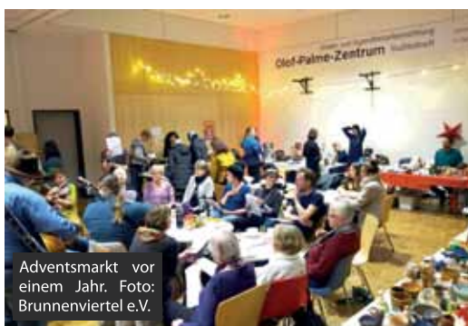
Adventsmarkt vor einem Jahr.

gramm. Sänger werden auftreten, „wobei Mitsingen ein wichtiger Bestandteil ist“, so Beate Chudowa. Die Veranstalter rollen im Foyer des OPZ Matten aus, auf denen Kleinkinder spielen können. Eine Kinderbetreuung wird angeboten. Im Saal gibt es Tee und Gebäck, Kaffee und Kuchen.