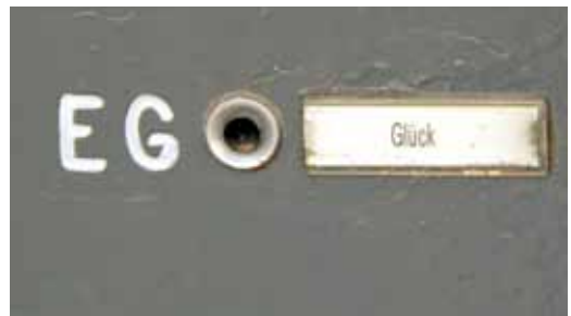
Das Glück wohnt auch im Brunnenviertel.