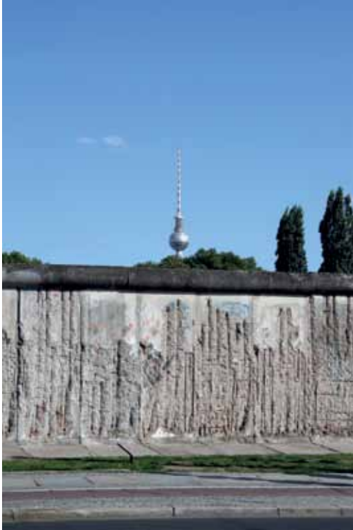
Blick über die Berliner Mauer an der Bernauer Straße zum Fernsehturm im ehemaligen Ostberlin. Auf dem Foto unten rechts ist Susanne Haun in ihrem Atelier zu sehen.

Die Grenzanlagen sollten eine Flucht in den Westen unmöglich machen. Nur wenige Menschen aus der DDR konnten den Westen tatsächlich kennenlernen. Wie hast du den Osten erlebt?