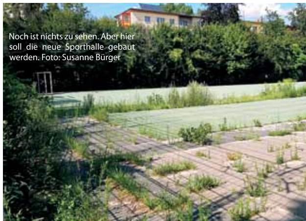
Noch ist nichts zu sehen. Aber hier soll die neue Sporthalle gebaut werden.

Wichtig für den Kiez: Der Neubau an der Vineta-Grundschule ist ein Ersatz für eine andere Sporthalle, die abgerissen wird. Die bisherige kleine Turnhalle der Schule bleibt daher weiterhin als Sportfläche geschützt. Sie darf nach Fertigstellung der neuen Sporthalle nicht einfach für andere schulische Zwecke genutzt werden.