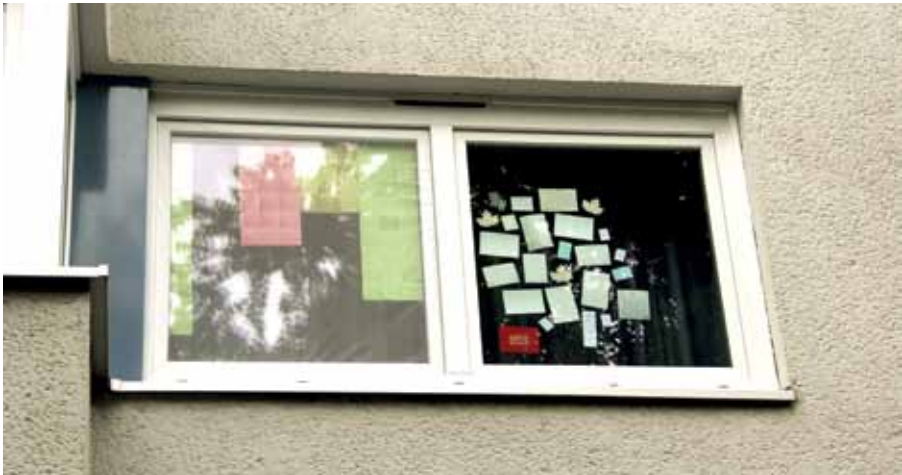
Sind das Haftnotizen mit Aufgaben an diesem Fenster oder ebenfalls gute Wünsche für den Kiez?

Ansonsten wünsche ich mir mehr Begegnung im Viertel. Wir haben das Olof-Palme-Zentrum, wir haben mit der Swinemünder Straße quasi eine Spielstraße. Da müsste doch noch mehr gehen! Vielleicht könnte es einen Wochenmarkt im Kiez, kleine Konzerte wie Vorspielaufgaben in der Musikschule geben?